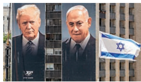
▲耶路撒冷街頭去年掛出特朗普（左）和內氏的宣傳海報。資料圖片

特朗普政府去年2月與阿富汗塔利班達成協議，承諾在今年5月1日前撤離所有美軍。美媒透露，如今仍有約3500名美軍駐紮在阿富汗。軍方人士擔憂，撤軍會加劇阿富汗暴力衝突。