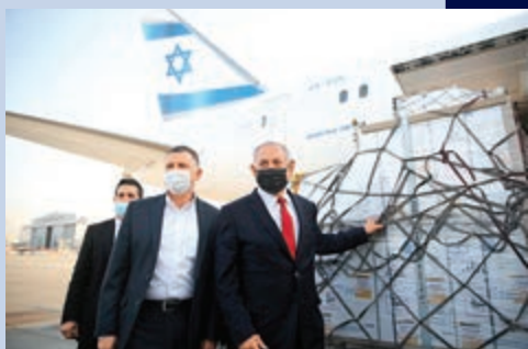
▲內氏（右）今年1月到機場迎接輝瑞疫苗。