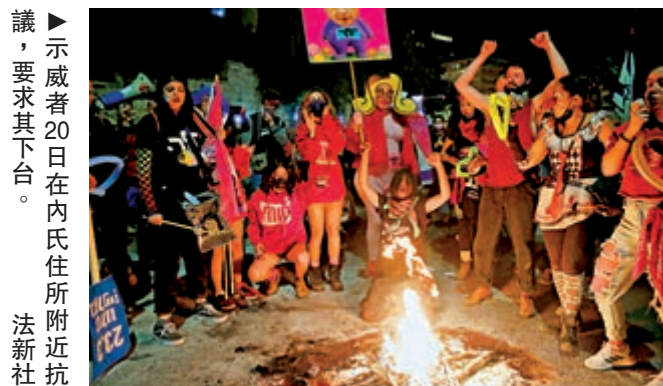
▲示威者20日在內氏住所附近抗議，要求其下台。