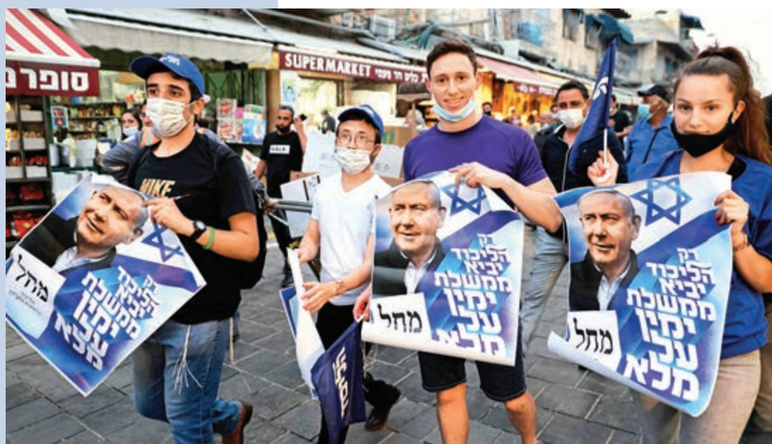
▲利庫德集團支持者21日在耶路撒冷遊行，為內氏拉票。