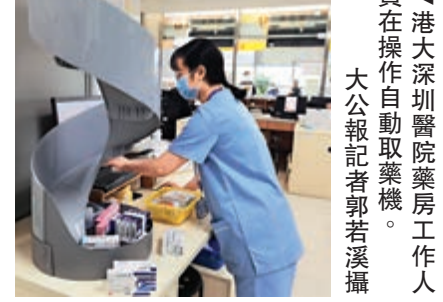
▶港大深圳醫院藥房工作人員在操作自動取藥機。

術職稱體系的轉評，首批香港正高、副高專家即將誕生。不僅方便醫生跨境執業，居民跨境就醫，更能加深深港醫療科研合作，讓香港醫生能更多參與到內地的醫療科研中。