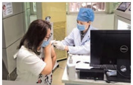
▲廣州市民正在接種新冠疫苗。

身體基礎狀況較好的老年人、其他需優先接種人群，也可在現階段開展接種。值得注意的是，廣東首次明確60歲及以上、有基礎性疾病（如高血壓、糖尿病等）的人群將接種，料在下半年啟動。