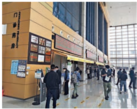
▲首批「港藥通」涉及10多種國際新藥。

據悉，今年下半年，香港大學深圳醫院將啟動「深港醫學專科培訓中心」招生計劃，探索建立與國際接軌的醫學人才培养模式；註冊成立「深圳市醫院評審評價研究中心」，計劃2021年內完成並通過ISQua國際認證，推進大灣區內國際化醫院質量評審認證一體化。