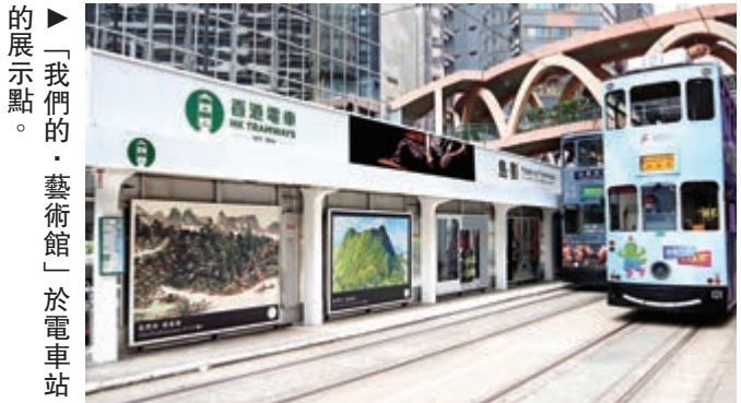
「我們的·藝術館」於電車站的展示點。