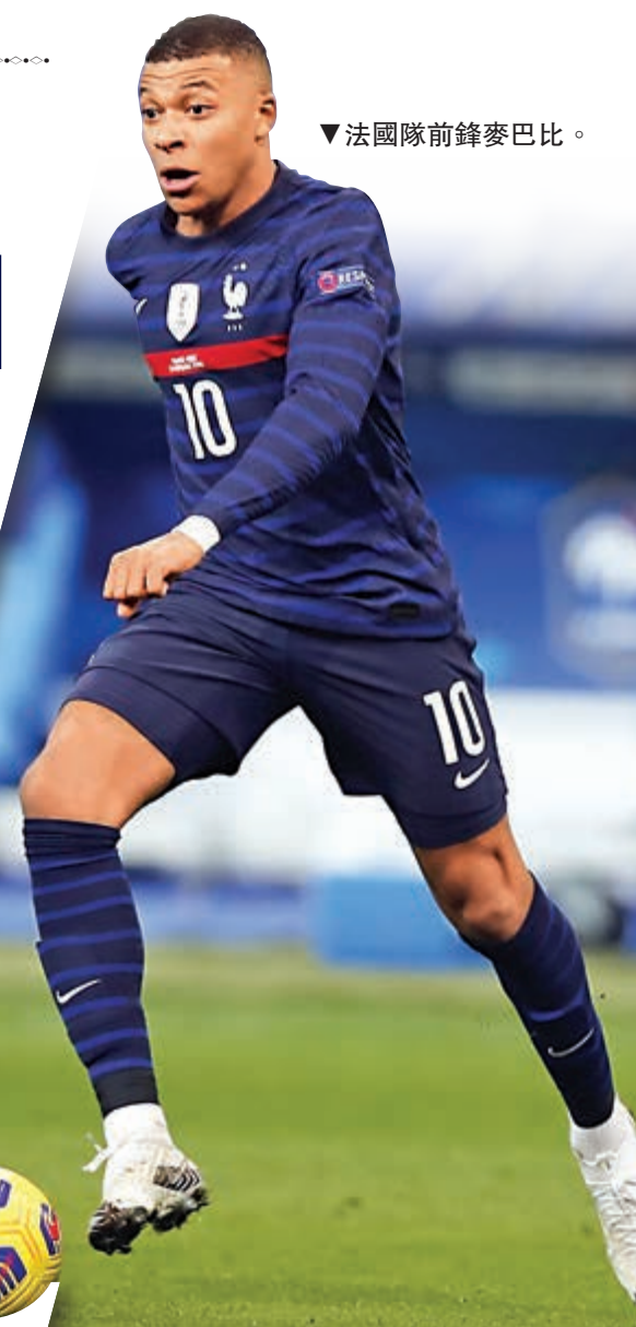
法國隊前鋒麥巴比。

2022年卡塔尔世界盃歐洲區外圍賽賽事正式開始，爭取衛冕冠軍的法國明晨於D組踏上征途，主場迎戰烏克蘭。法國自世盃奪冠後仍保持水準，如在歐國聯亦打入最後四強，預計這支勁旅會在基沙文、基利安麥巴比及保羅普巴等主將協助下旗開得勝。烏克蘭隊由名宿舒夫真高任主帥，球隊有效力韋斯成的耶莫蘭高、曼城的辛真高兩位名將，雖然未必能與法國周旋，但博取入波向球迷交代料仍能做到，故今仗足智彩宜博入球大。(有線601及661台明天凌晨3時45分直播)