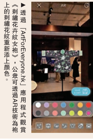
透過「ArtForEveryone.hk」應用程式觀賞《刺繡花卉紋女袍》，公眾可透過AR技術為袍上的刺繡花紋重新添上顏色。