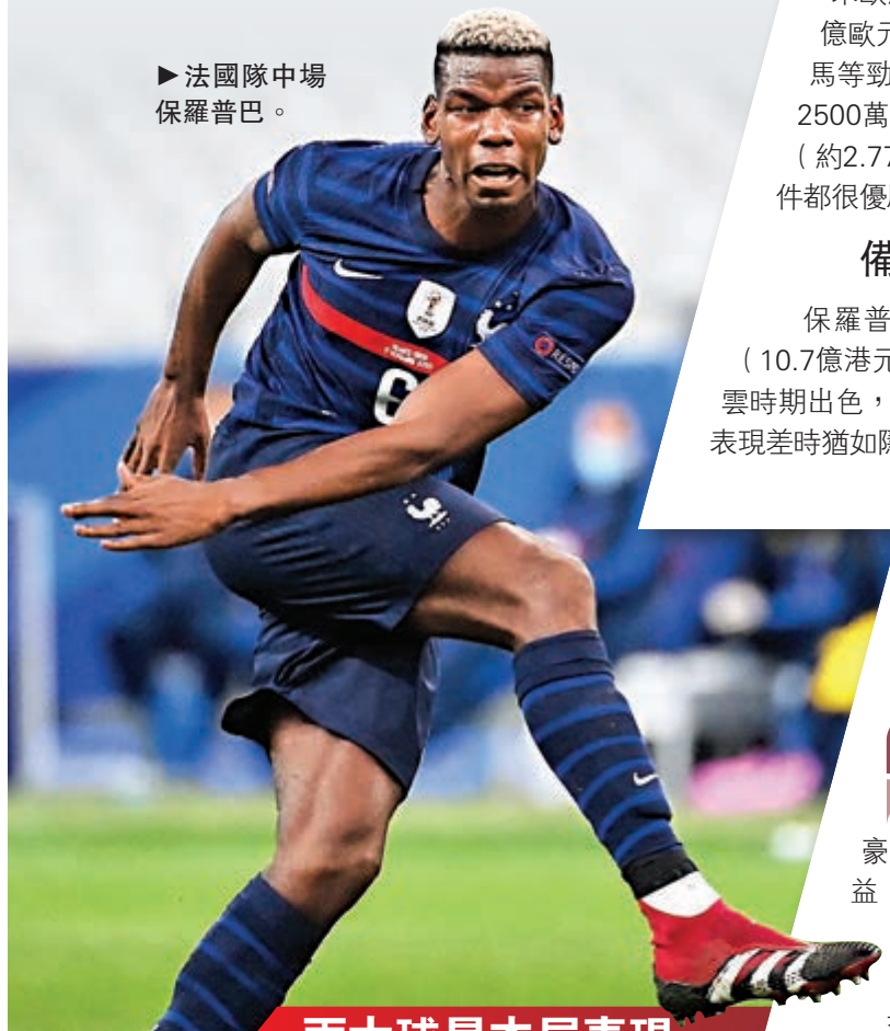
法國隊中場保羅普巴。

【大公報訊】據ESPN FC報道：法國自2018年高舉世界盃冠軍後，陣中球星備受歐洲強豪注視，其中效力巴黎聖日耳門的基利安麥巴比，及曼聯的保羅普巴屬法國身價最高的當家球星。無獨有偶，兩人均與所屬球會僅餘一季合約，兩隊更同樣未必能夠挽留兩人，令他們有着不同「煩惱」。