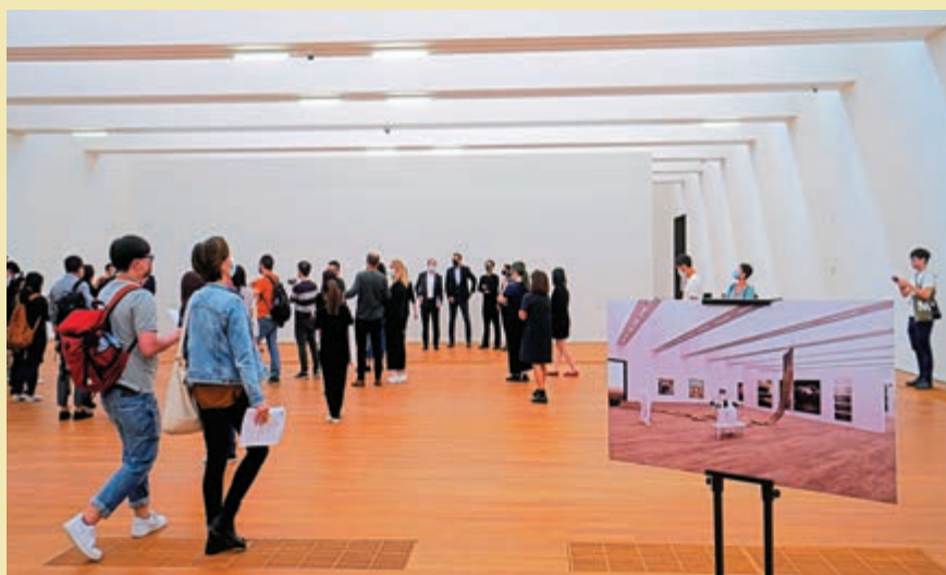
▲西九文化區管理局董事局內只有兩位與藝術沾邊的人士，有藝術界人士直指是「外行領導內行」。