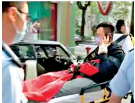
▲被斬傷的的士乘客，由救護車送院。

【大公報訊】記者黃浩輝報道：尖沙咀和灣仔均發生街頭血案！昨早七時許，警方接報指柯士甸道近漆咸道南，三名黑衣男子持刀、斧頭及鐵錘，斬傷的士司機及乘客，的士大銀幕被打爛，車廂滿布玻璃碎及血漬，兇徒作案後往漆咸道南方向離開，暫未有人被捕。另外，昨清晨五時許，四名男子行經莊士敦道181號對開時，被三名持刀男子襲擊，兇徒得手後逃去無蹤，警方正追查事件成因，暫未有人被捕。