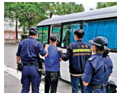
▲入境事務處在全港展開反非法勞工行動，懷疑非法勞工被捕。

於「曙光行動」中，入境處特遣隊人員搜查了149個目標地點，包括食肆集中區、按摩店、裝修中單位、私人屋苑、餐廳及店舖，共拘捕六名懷疑非法勞工及四名涉嫌