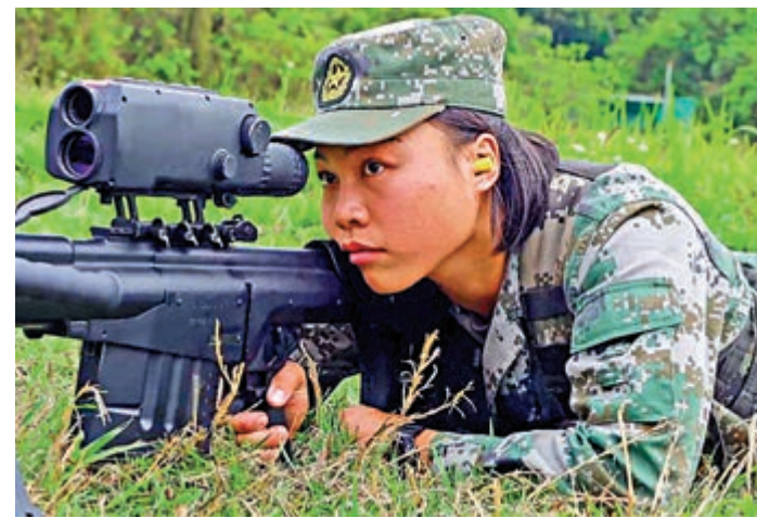
▲儀仗隊女兵手持狙擊槍參加集訓，展現「紫荊玫瑰」的颯爽英姿。

演練中，陸海空各分隊採取自主協同的模式，成功組織聯合巡邏、聯合搜救、兵力投送等課目演練，航空兵、防空兵、雷達兵、艦艇等軍兵種分隊互為條件的對抗訓練貫穿始終。