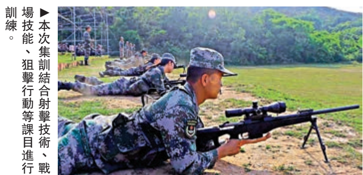
▲駐港部隊某旅組織狙擊手集訓，隊員們進行狙擊訓練。 ▲本次集訓結合射擊技術、戰場技能、狙擊行動等課目進行訓練。