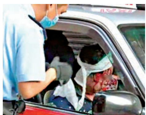
▲的士司機滿面血跡，在車內接受治療。