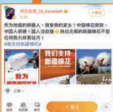
▶可蘭白克在微博表達他熱愛家鄉的情懷。