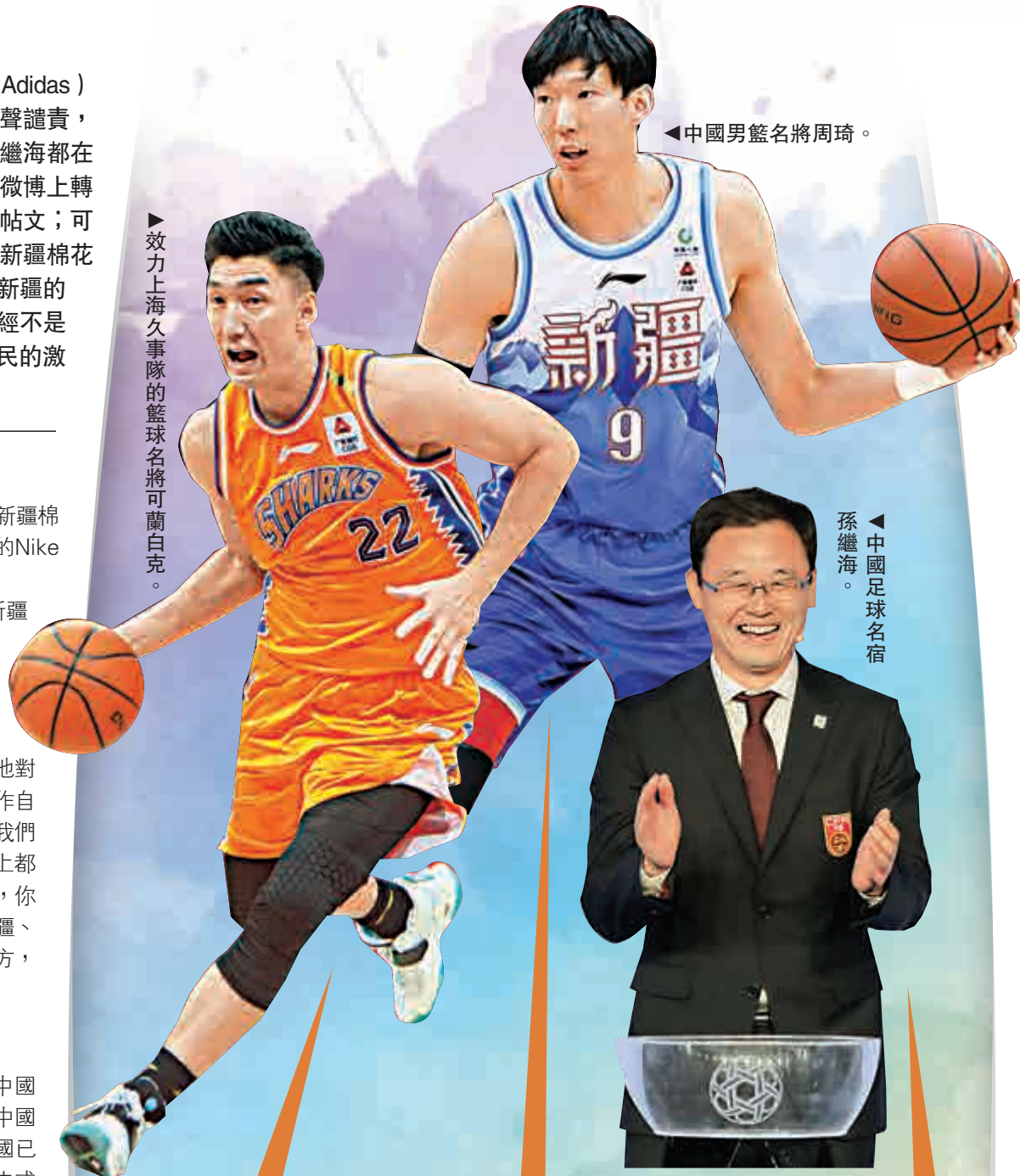
◀中國男籃名將周琦。

文中強調，事實證明，中國足球圈在大是大非問題上的敏感性和行動力是毋庸置疑的。儘管中國足球自身尚有很多問題需要改善和解決，但一旦我們國家尊嚴面臨刻意抹黑和惡意攻擊時，中國足球一定會在第一時間，大聲地堅決地，向對方說出「不」。