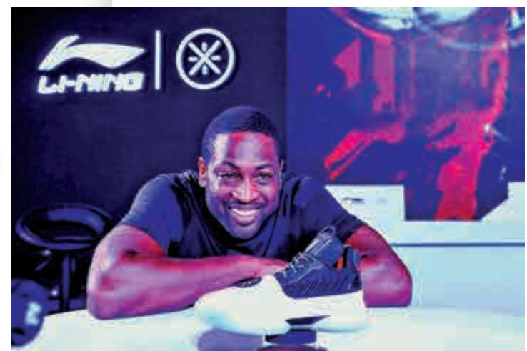
▲華迪是李寧品牌的巨星級代言人。