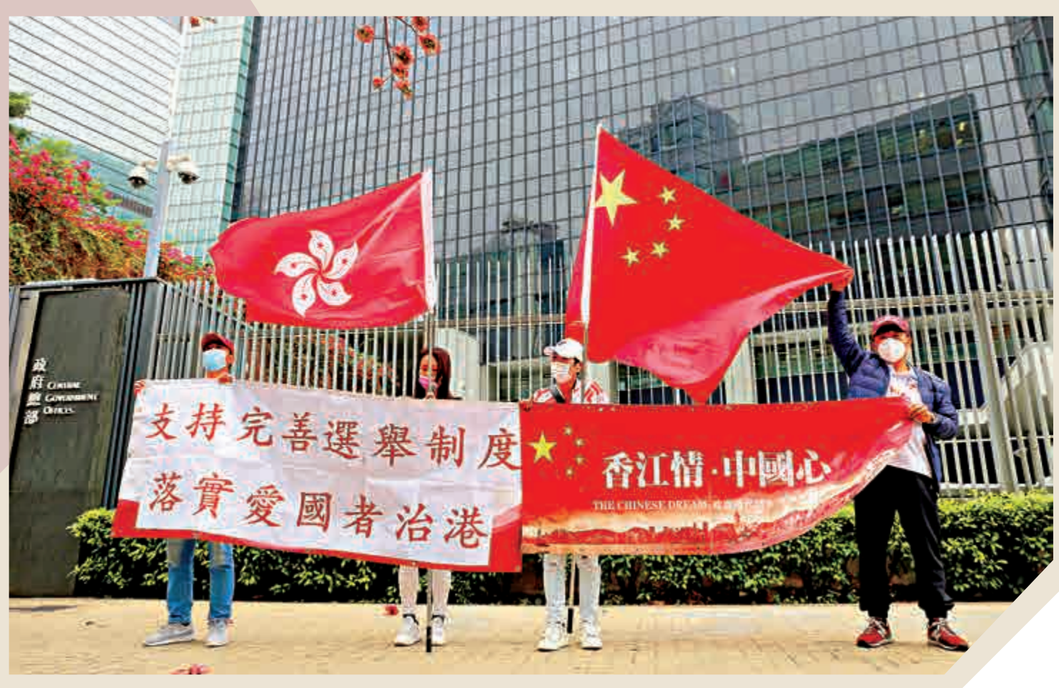
市民在政府總部前展示國旗、區旗和標語，支持完善選舉制度，落實愛國者治港。