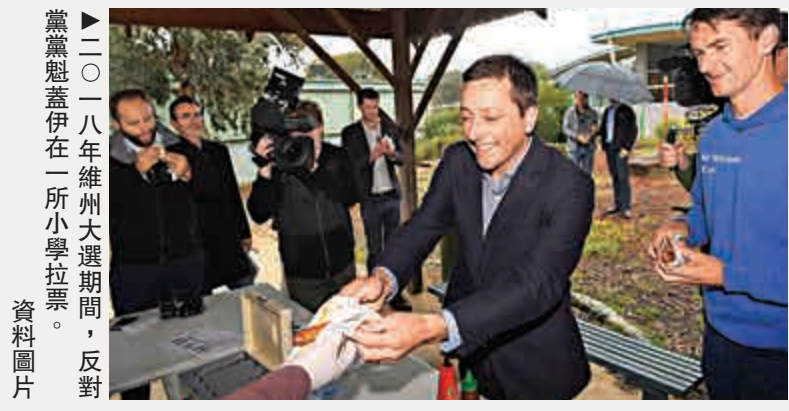
▲二〇一八年維州大選期間，反對黨魁蓋伊在一所小學拉票。

這一法案由維州執政黨工黨提出，並得到廣泛支持。州政府表示，維州如今擁有澳洲「最嚴格和最透明」的政治捐款法律，將增強維州民眾對政黨政治決策的信心。不過遭維州時任反對黨魁蓋伊極力反對法案通過，指有法律建議表示工黨將通過工會聯盟斂取約600萬澳元潛在資金。對此，維州政府駁斥說工會捐贈將和其他公司一樣被限制在4000澳元內。工黨又炮轟蓋伊一直竭力保護「狡猾」的不正當行為，後者多次強調維州的大公司和開發商將是他領導的政府核心，被指想把維州帶回到「只崇尚金錢的時代」。