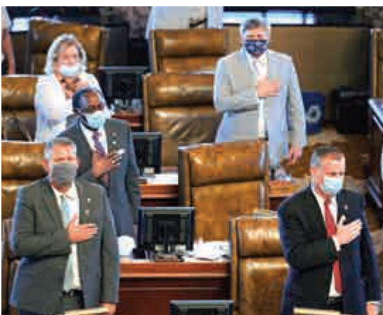
▲密西西比州參議院去年8月開會前，議員們集體宣誓。

●除正式選舉規則外，以愛國主義為基礎的選舉文化也是參選人必須遵從的「遊戲規則」。各方候選人為贏得選民支持，在競選過程中都極力展示愛國熱情。公眾對候選人愛國言論的嚴謹性要求非常苛刻。