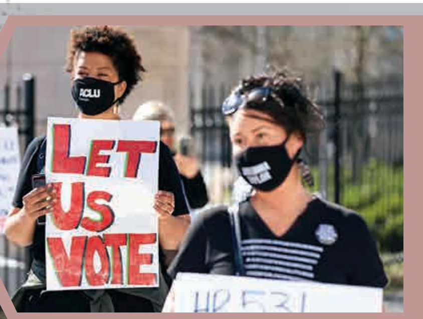
▲4日，佐治亞州民眾在州議會外抗議選民的投票門檻被抬高。