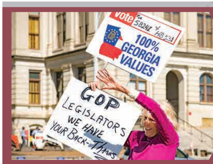
▲支持修改州選舉法的佐治亞州民眾8日在州議會外慶賀。