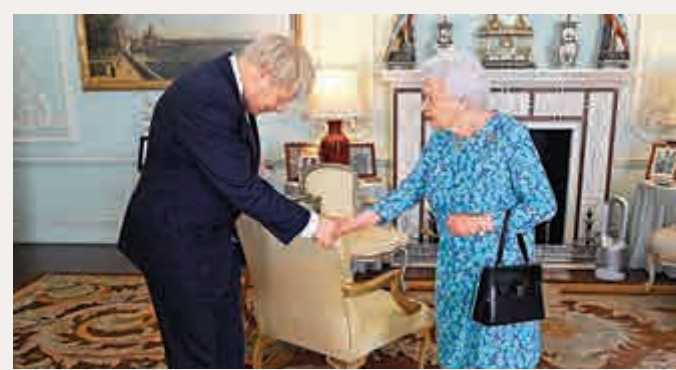
▲二〇一九年七月，英女王正式接見新任首相約翰遜。