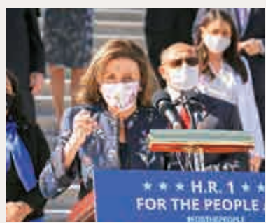
▲「為了人民法案」本月3日在眾議院通過後，眾議院議長佩洛西在國會外發表講話。

這項法案編為眾議院一號法案（H.R.1），11日由參議院接收即將進行激辯。由於前總統特朗普去年大選期間不斷散播「選舉舞弊」陰謀論，敗選後亦拒絕認輸甚至煽動支持者衝擊國會震驚全球，民主黨便在拜登上任未足百天之際迅速推動選舉改革。