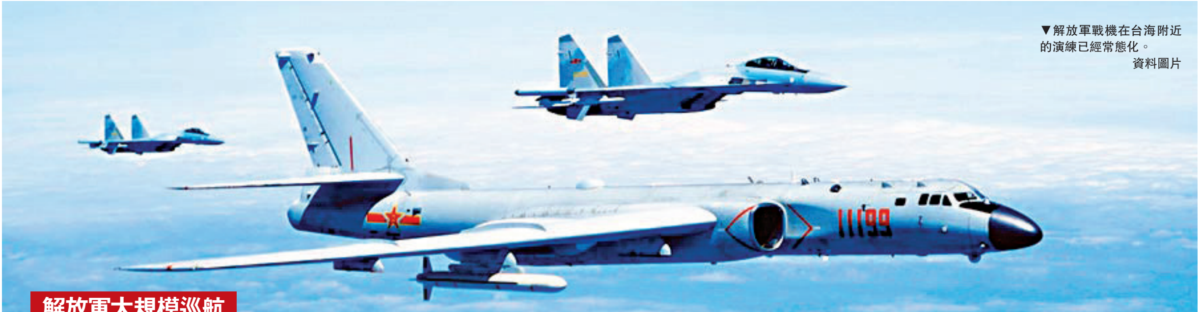
▼解放軍戰機在台海附近的演練已經常態化。 資料圖片