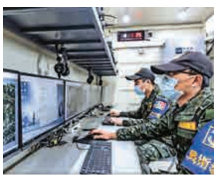
▲台軍引進美軍現役實兵模擬接戰系統。