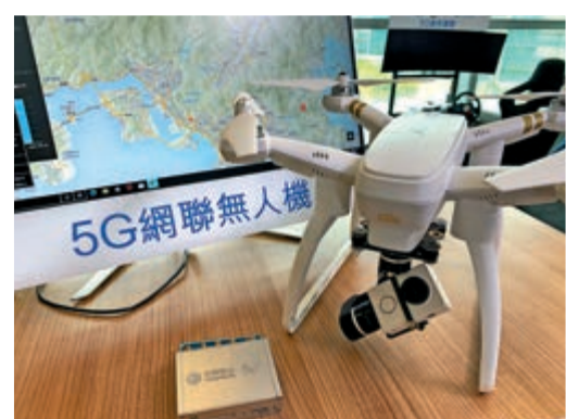
▲中移動香港的5G聯網無人機解決方案,配合自主研发的「哈勃一號」接口。

古星輝提到,疫情打亂全球供應鏈,3香港的基站設備供應亦無一幸免,貨源供應嚴重受阻,加上限聚令亦影響工程人員進出建築物及施工場地,惟幸已成功在3.5吉赫黃金頻段建設超過1000個基站。