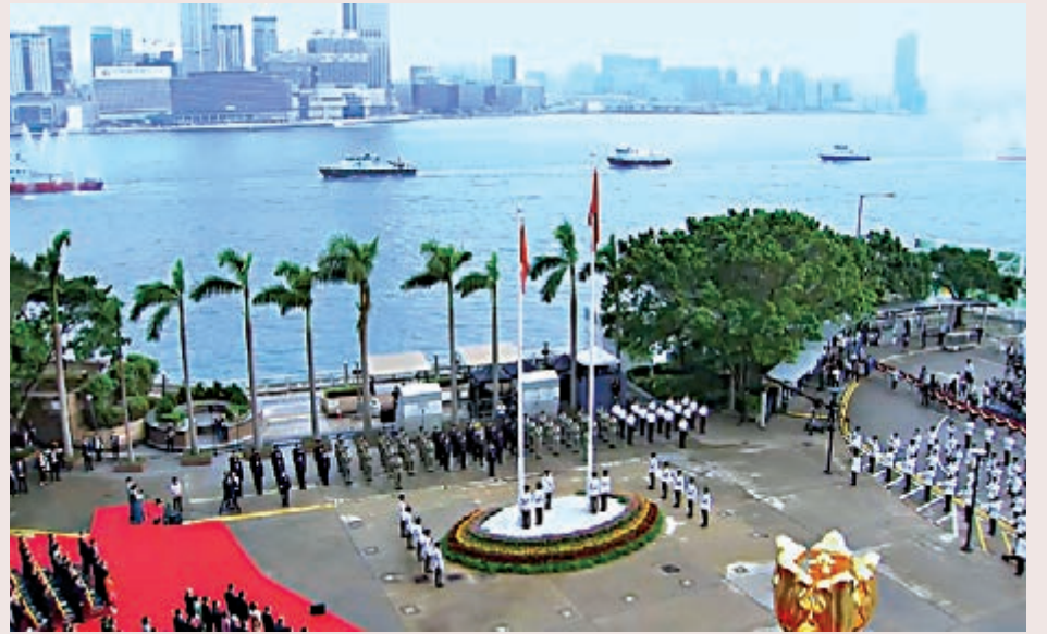
▲二〇一九年「國歌快閃」活動有香港社會各界人士參與。影片截圖

場，同時輔以尖沙咀、南丫島、香港大學、香港科學園、香港國際機場、西九龍高鐵站和港珠澳大橋等十五個地標為分場，特殊的城市熟悉的地標讓短片格外引人關注。二是代表性。這部短片的主辦方邀請了包括政界、商界、學界、演藝界等香港各界有影響人士，特別邀請了院士學者、青年學生、「東江縱隊」老戰士和外籍人士參與。主場主唱人士更是星光熠熠，包括成龍、譚詠麟、張明敏、鄭美雲、霍啟剛、郭晶晶等。通過名人效應提升吸睛效果，有效促進了節目的傳播擴散。三是故事性。短片從講故事開始，一名靚麗的女教師帶了四十名中小學生來金紫荊廣場觀看升旗儀式，現場講述國歌故事。童聲唱響「起來」時，農運人士、早讀學生、觀光老外和周邊遊客自發響應參與，許多場景令人動容。四是專業性。這部短片由行業領先的香港視頻製作公司前期拍攝、後期製作和節目包裝，邀請專業的警察樂隊演奏國歌，還通過航拍、三百六十度全景等技術應用突出特效，觀之令人賞心悅目。