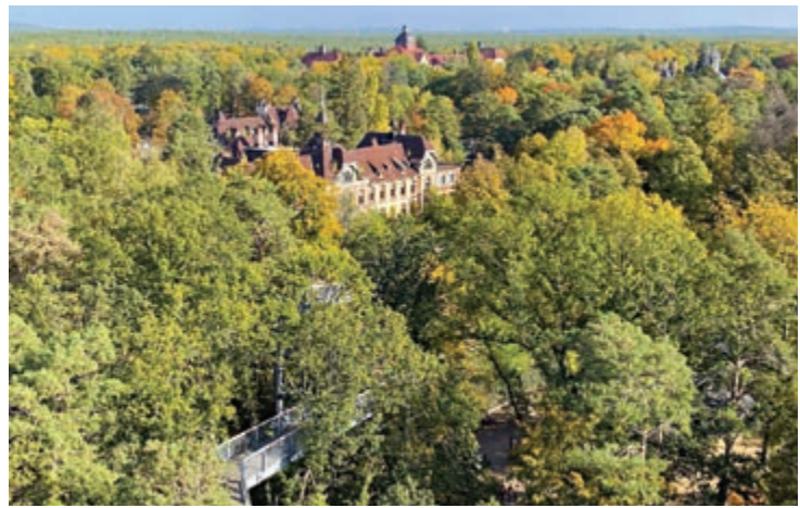
舊址。綠林中的比利茲樹頂步道和比利茲醫院。

在天橋的兩側，分別有兩個洞一樣的「出口」，小朋友可爬出去。這個「洞口」外面連接的是一個鐵網做的通道，大小剛夠一個人彎着身體爬過。兩個洞口連着的通道，一個向下，像懸掛在天橋下的管道，管道從天橋的下面繞到另一邊繞回到天橋上；另一個向上，從天橋的上方通過像一個拱橋。小朋友們排隊在這個通道裏「爬行」，有點害怕，又很享受在半空中鏢空的鐵網管道裏爬來爬去的刺激感。