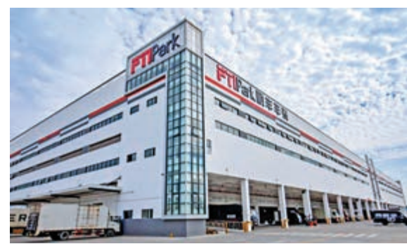
圖為佛山桂城豐泰產業園。