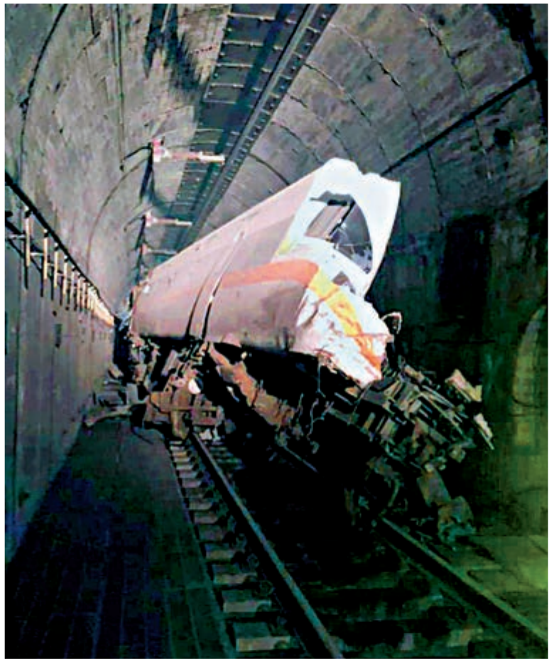
▲衝進隧道的列車車頭像豆腐一樣被切開。