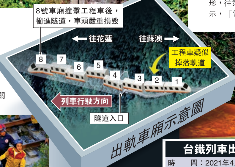
8號車廂撞擊工程車後，衝進隧道，車頭嚴重損毀