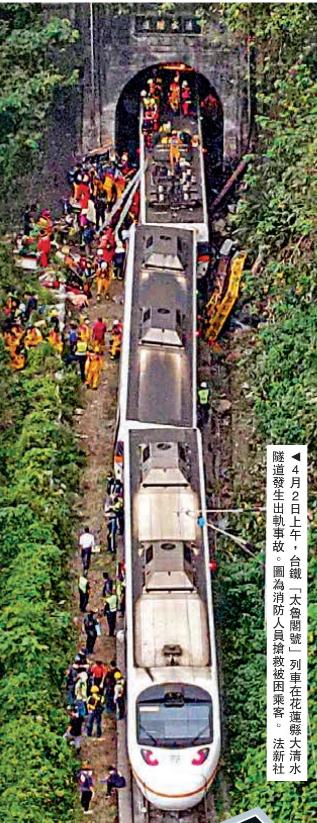
▲4月2日上午，台鐵「太魯閣號」列車在花蓮縣大清水隧道發生出軌事故。圖為消防人員搶救被困乘客。