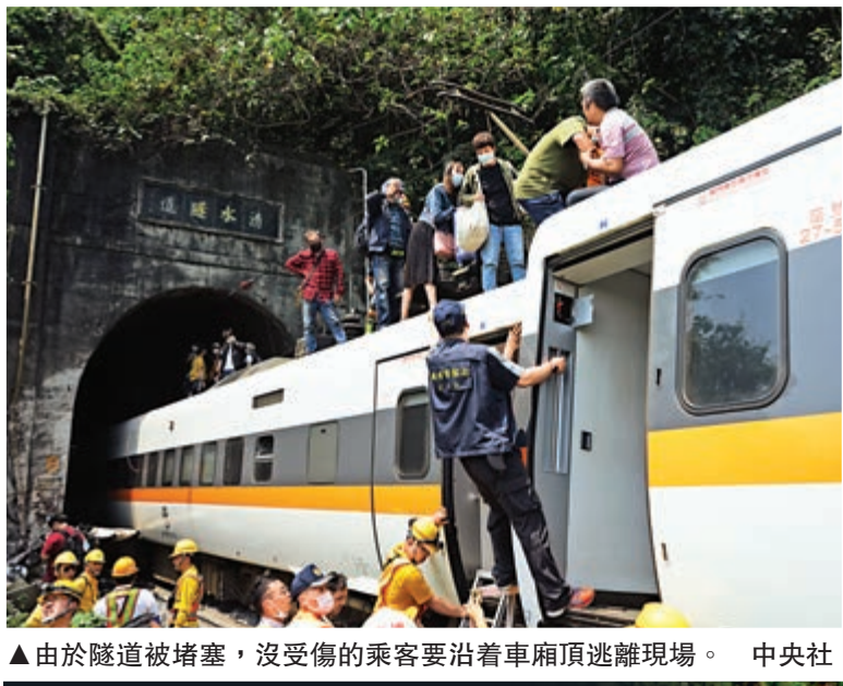
▲由於隧道被堵塞，沒受傷的乘客要沿着車廂頂逃離現場。