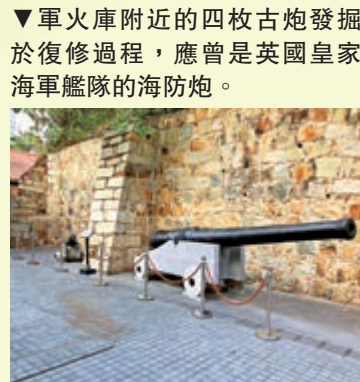
▼軍火庫附近的四枚古炮發掘於復修過程，應曾是英國皇家海軍艦隊的海防炮。