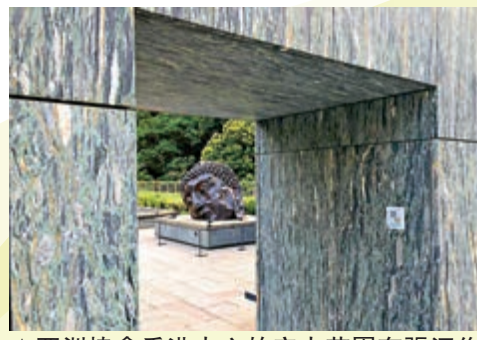
▲亞洲協會香港中心的空中花園有張涇作品《長島佛》。