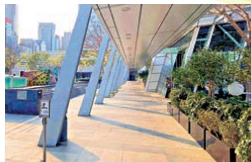
▲位於中環IFC的平台花園。

在這裏有被青青草地包圍着，與旁邊的高樓大廈形成對比。這裏亦擺放了多個不規則形狀的裝飾，在花園的中央有長方形水池，水池在陽光的照射下，倒映出高樓的影子，幾有趣味。花園內設有不少座位，有人會購上外賣在這裏好好享受；又或者有人會在這裏靜靜欣賞香港的景色。