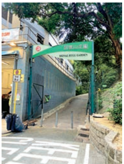
▲訊號山花園所在位置偏僻，路過也較難發現。

一步入訊號塔，就看到旋轉樓梯：樓梯非常窄，每次都只能容納一個人上落。訊號塔內則是四邊窗口設計，而三樓原本有一條爬梯通往，不過現已封閉。走在塔內，遠眺窗外的寫意風景，不過眼前已被不少高樓大廈和樹木所遮擋視線。在訊號山花園內，幾乎每幾步都會有椅子供遊人就坐休息，讓人坐在這裏思考人生的同時，還能將煩惱忘卻，甚是抒懷。