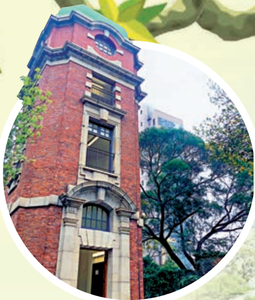
▲訊號塔帶有濃厚的古典巴洛克色彩。