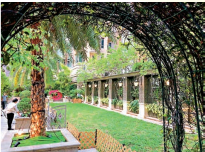
▲位於利東街居然有一處秘密花園。

在這裏，軍火庫的基本建築結構和特色基本被保留下來，如由花崗岩興建而成的炸藥儲藏庫、經過活化後成為現在的麥禮賢夫人藝術館、館外左右的兩枚大炮等，都甚具歷史意義。