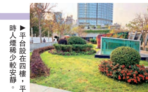
▶平台設在四樓，平時人煙稀少較安靜。