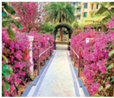
▲路兩旁種滿鮮花，前面有一道拱門，充滿畫意。可以與另一半一起坐在南瓜車上談心。

此外，這裏有一架白色南瓜車，絕對是拍照焦點，與情侶一同坐上去還是蠻有感覺的。不過一到周末，就會有很多人前來打卡，讓這個秘密花園增加不少曝光率。