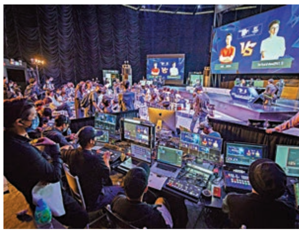
▲賽事場面熱鬧。