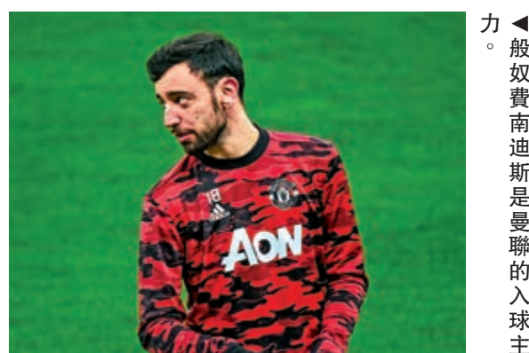
▲般奴費南迪斯是曼聯的入球主力。