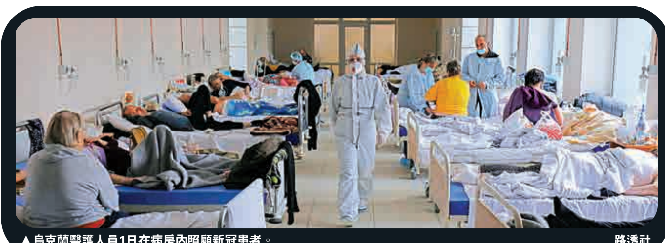
▲烏克蘭醫護人員1日在病房內照顧新冠患者。