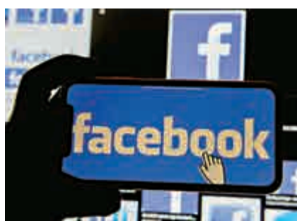
▲Facebook有5.33億用戶資料遭到洩露。

【大公報訊】綜合《商業內幕》、俄羅斯衛星通訊社報道：當地時間3日，社交媒體Facebook(Fb)超過5億用戶的個人資料在一個黑客討論區被公開，