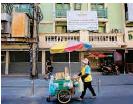
▲泰國曼谷原先滿是遊客的街道下變得冷清。法新社

【大公報訊】綜合Thaiger網站、《信使新聞》報道：為重振旅遊經濟，泰國政府擬分四階段解除入境限制。自4月1日起，接種疫苗人士入境泰國將不再需要隔離。泰國政府認可科興、阿斯利康、強生、輝瑞及莫德納疫苗。