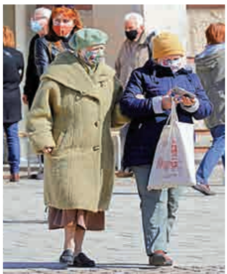
▲波蘭民眾2日離開疫苗接種中心。

同樣購買了俄羅斯「衛星5號」的斯洛伐克亦已有15%人口接種首劑疫苗，勝過歐盟，但政府卻陷入執政危機。此前，前總理馬托維奇在執政聯盟內部未達成一致意見的情況下，自行與俄羅斯簽訂了「衛星5號」疫苗採購協定，以期加快疫苗接種進度，應對該國來勢洶洶的第三波疫情。而同屬執政聯盟的自由與團結黨和惠民黨則反對使用未經歐洲藥品管理局(EMA)批准的疫苗。前第一副總理兼經濟部長蘇利克要求馬托維奇辭職。其後，馬托維奇於3月30日宣布辭去總理職務，並與財政部長黑格爾調換職位。