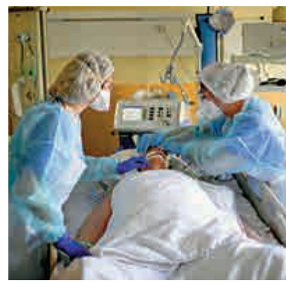
▲法國醫護人員2日照顧ICU新冠患者。法新社

【大公報訊】綜合法新社、路透社報道：法國遭受第三波新冠疫情影响，3日通報新增213宗死亡病例，累計死亡人數逼近10萬。但醫護人員擔心，疫情的高峰可能仍未到來。