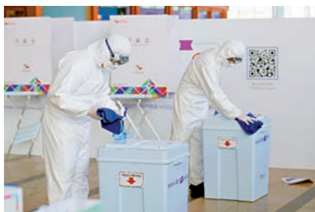
▲工作人員1日在首爾市長補選票站進行消毒工作。

400至600的高位，今後可能繼續惡化，因此將數值控制在300至500範圍內至關重要，否則就需要採取更嚴格的防控措施。當局呼籲民眾今後一個月盡量不要聚集，並積極接種疫苗。