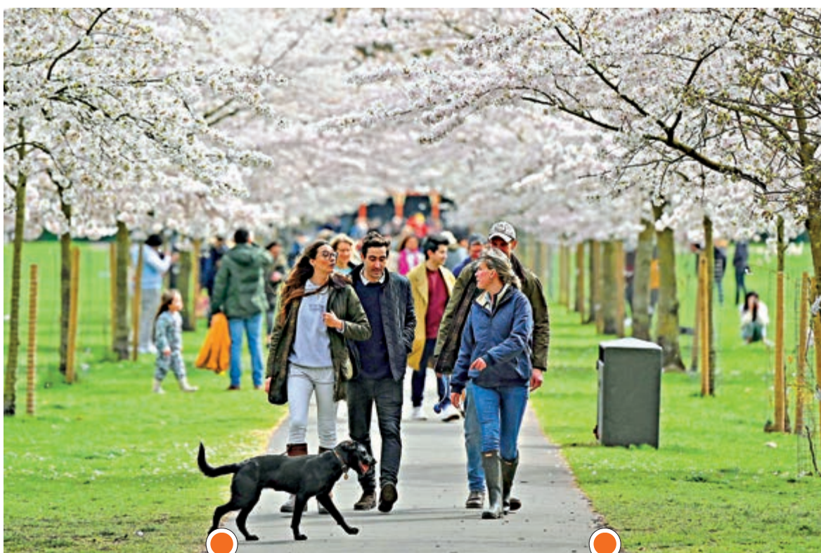
逐步解封的倫敦居民3月28日在公園散步，享受春光。