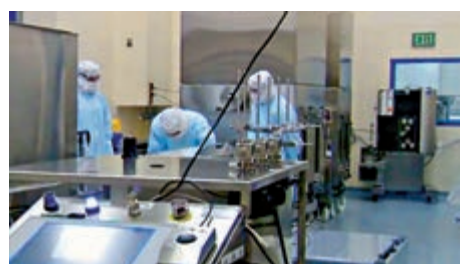
▲新興生物科技公司的疫苗工廠已被強生接管。視頻截圖

工廠增派管理人員進行質量管控，並提高疫苗產量，以確保完成5月底前向美國政府供應1億劑疫苗的目標。此前的事故對實現該目標造成負面影響，也導致美國食品與藥物監督管理局(FDA)延遲頒發生產線授權許可。強生公司表示，將繼續與FDA合作，爭取盡快拿到緊急使用許可。