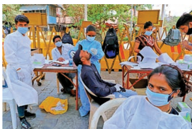
▲孟買醫護人員5日為民眾採樣進行病毒檢測。

馬哈施特拉邦4日宣布，自5日起，周一至周五每晚8點至次日早7點實施宵禁，周六和周日則全天封鎖，封鎖期間所有非必要商舖關門，居民不得無故外出。工作日的白天，當地實施5人以上限聚令，並