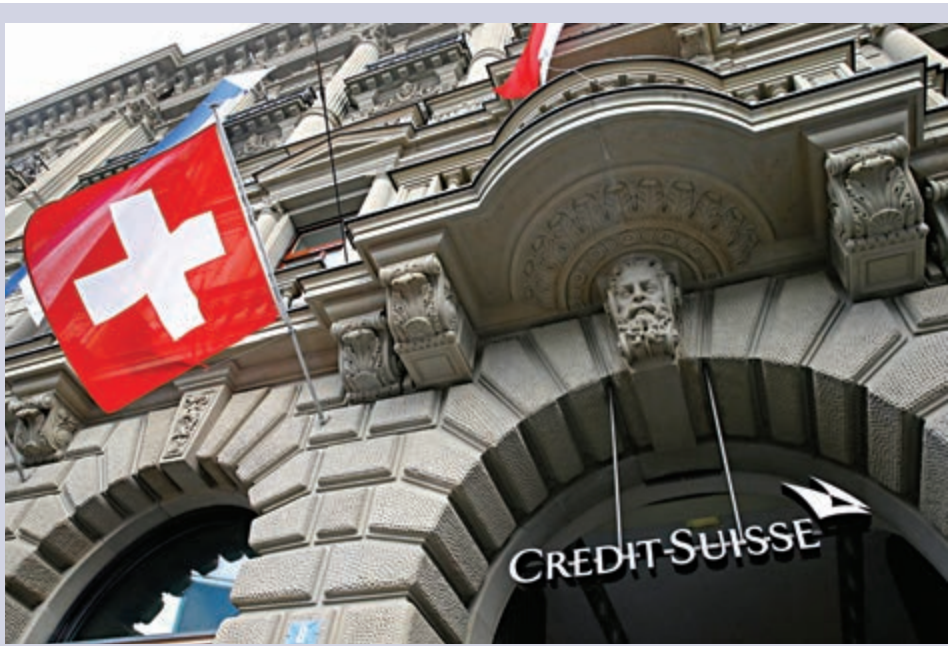
▲瑞信集團最新表示，料需為爆倉撥備47億美元（約365億港元）。

瑞信首席執行長Thomas Gottstein原希望順利渡過充滿難題的2020年，不料卻因為Archegos跟Greensill事件功虧一簣，他誓言將汲取「嚴肅的教訓」。