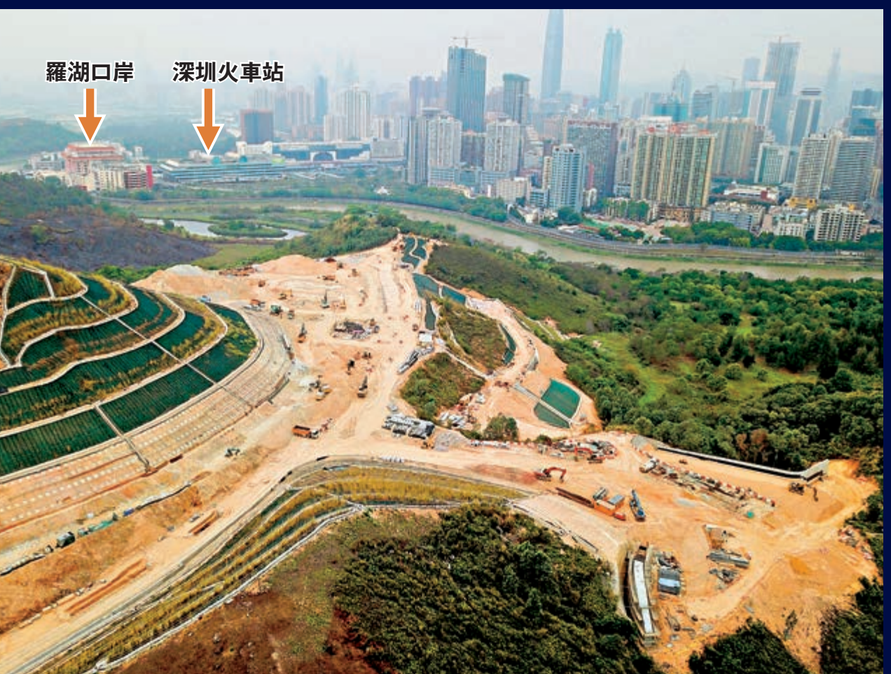
沙嶺殯葬城位處羅湖及文錦渡中間，距離深圳市不足三百米。