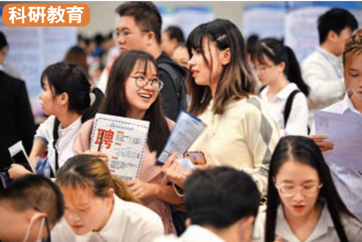
● 鼓勵高校科研成果市場化落地海南，支持國內知名高校在海南建立國際學院，鼓勵海南大力發展職業教育。