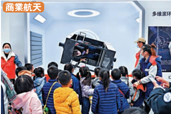
● 優化海南商業航天領域市場准入環境，協同推動配套產業鏈發展，支持海南建設開放型、國際化的文昌國際航天城。