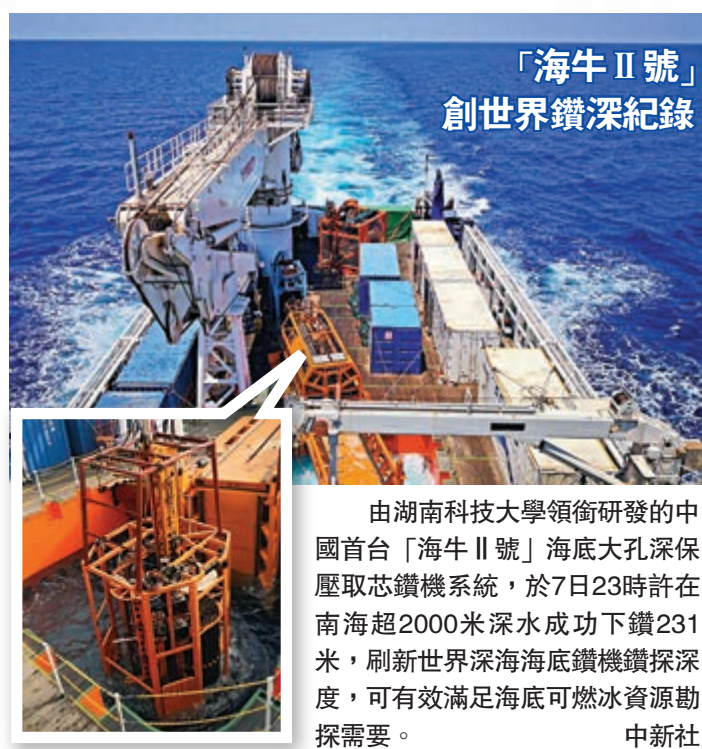
「海牛II號」創世界鑽深紀錄

《特別措施》還提出，鼓勵文化演藝產業發展的措施，在充分發揮行業協會等社會組織作用、加強行業自律的基礎上，着力優化營業性演出審批方式、規範審批標準，將進一步激發海南文化演藝產業活力，推動全國、「一帶一路」沿線國家乃至全球最優質的文化演藝行業的表演、創作、資本、科技等各類資源向海南聚集，將海南打造成为社會主義文化強國開放、包容、自信的新窗口。