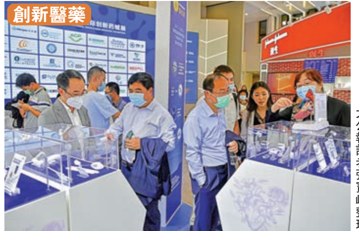
● 開展互聯網處方藥銷售，鼓勵已獲得上市許可的創新藥，由具備條件的海南醫療機構按照「隨批隨進」的原則直接使用。