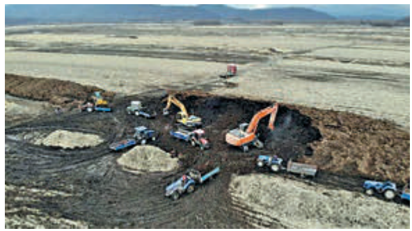
▲工作人員在回填被盜挖的黑土。

被承包出去的土地分為盜取的土地和用作晾曬的土地，其中用來盜取的土地承包價格是每畝年租金為7000元左右。福太村的村民說，因土地位置和每年產量的不同，價格也分高低，當地最好的土地每年每畝出租價格為6000元，被盜取的土地正常是租不上這個價格。3月初，福太村被承包耕地上就出現了大型挖掘設備開始挖土，被控