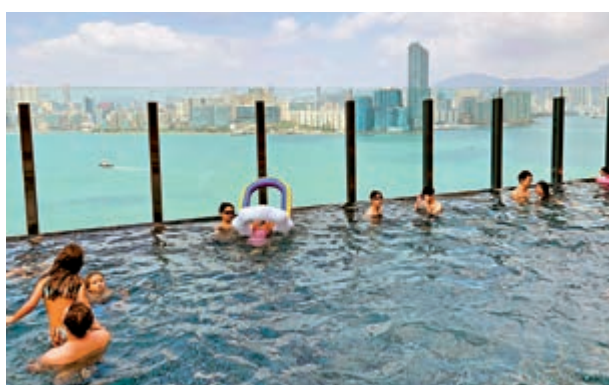
▲泳池是酒店吸引市民Staycation的亮點設施之一。