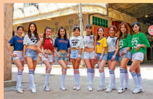
佛山國藝影視城已具規模，亞姐候選佳麗亦曾在此進行外景拍攝。資料圖片