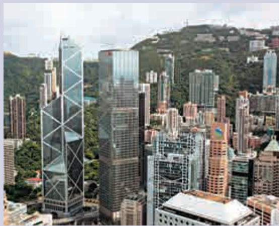
▲短期而言，香港銀行業仍將面對逆境。