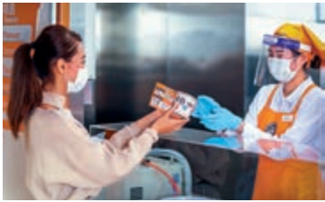
▲參與「穀物麥片工作坊」，大家可在杯上畫畫。

了解穀物麥片誕生的緣由及製作過程。全球獨家限定的穀物麥片工作坊，參加者可在「清仔」的帶領及互動下了解穀物麥片的製作技巧，並選擇喜愛的配搭材料。