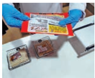
▲手動體驗壓製麵餅的過程。 ▲麵餅製作完成後裝袋。