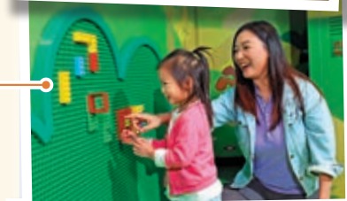
▲小朋友在得寶農莊玩樂。

得寶穀倉外形滑梯(約高2米)，並有約30厘米高動物模型，以及小朋友最愛的大型得寶軟積水池。 註：適合1至5歲小朋友參與