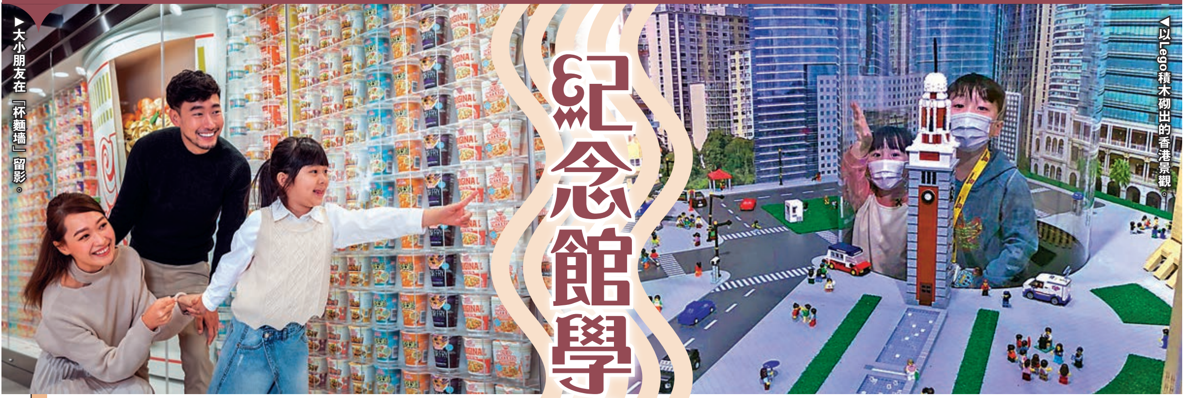
大小朋友在「杯麵牆」留影。