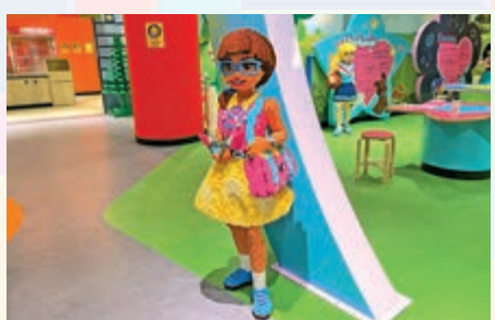
▲以Friend系列為主題打造的夢幻樂園。

以Friend系列為主題打造，是不少女孩的夢幻樂園。心湖城共設有三個Play Table，讓小朋友發揮小宇宙裝飾城市，其內是屬於五位樂高好朋友(Olivia、Stephanie、Emma、Andrea及Mia)的家。