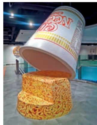
▲「大杯麵」打卡位。 ▶多款紀念精品。