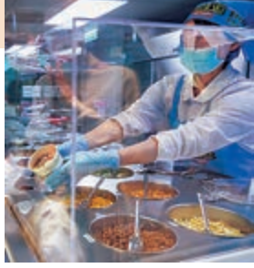
參加者可選擇自己喜歡的配料。