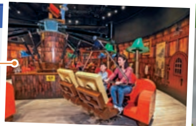
▲猶如魔法世界的魔法轉盤。