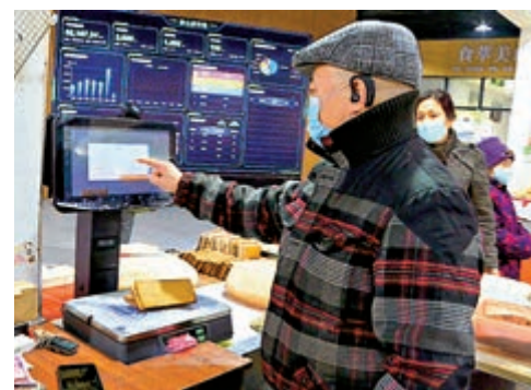
▲ 數字化民生菜市場讓買賣變得更智慧。