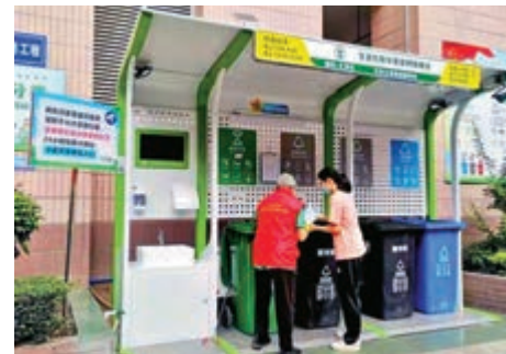
▲ 一批新型智慧垃圾分類亭在廣州白雲區正式上崗。