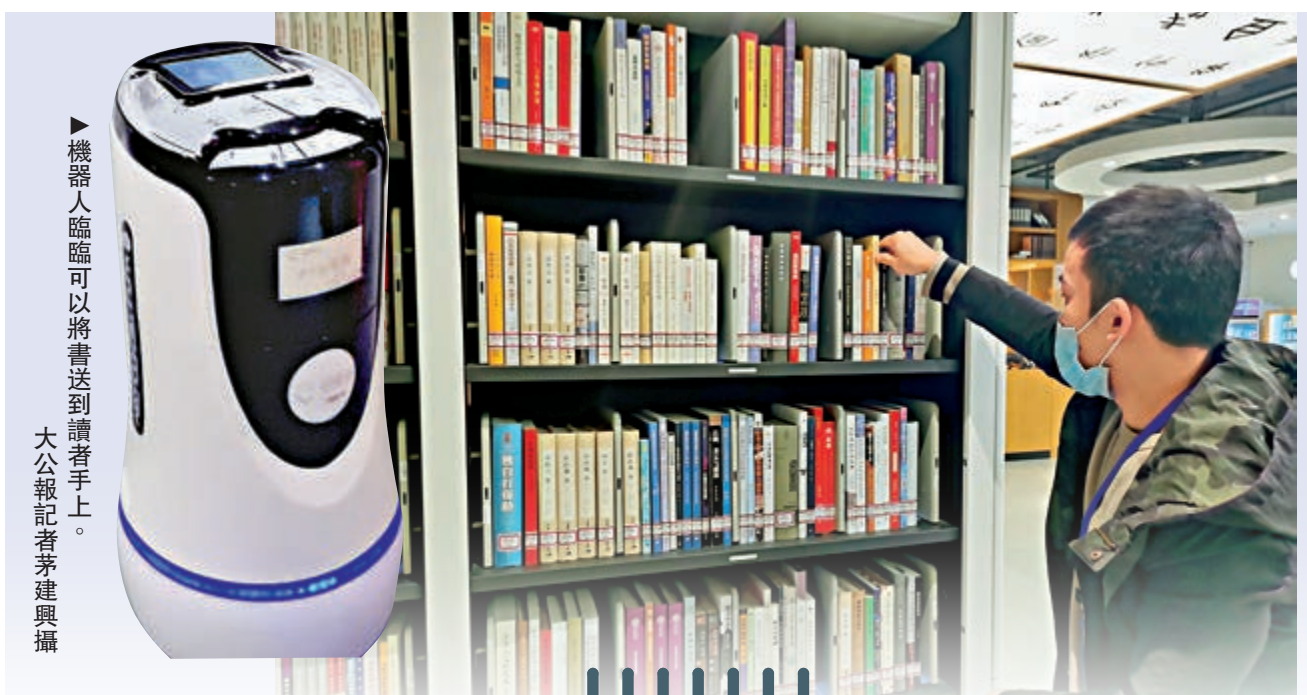
▲ 機器人臨臨可以將書送到讀者手上。

在智慧圖書館的借還功能，可以通過支付寶掃碼，人臉識別以及刷身份證、讀者證等進行借閱，非常方便。