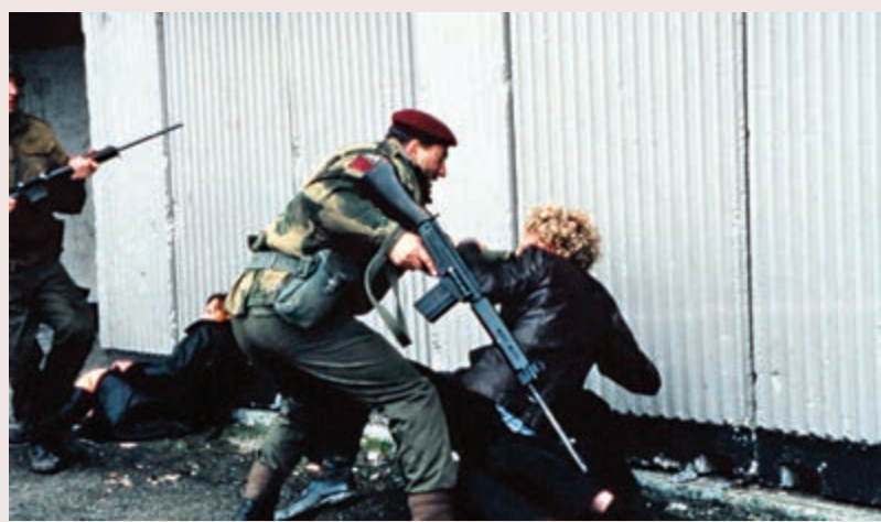
▲紀實電影《血色星期天》講述一九七二年初派駐北愛爾蘭的英軍鎮壓平民的流血事件。