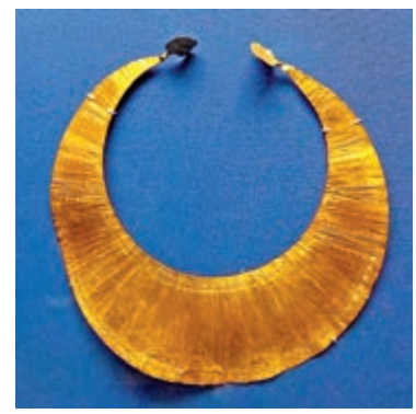
▲愛爾蘭史前「小月亮」項圈金飾。