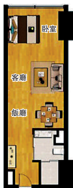
▲圖為兆鑫匯金廣場1房1廳朝向東南的62平米的戶型圖