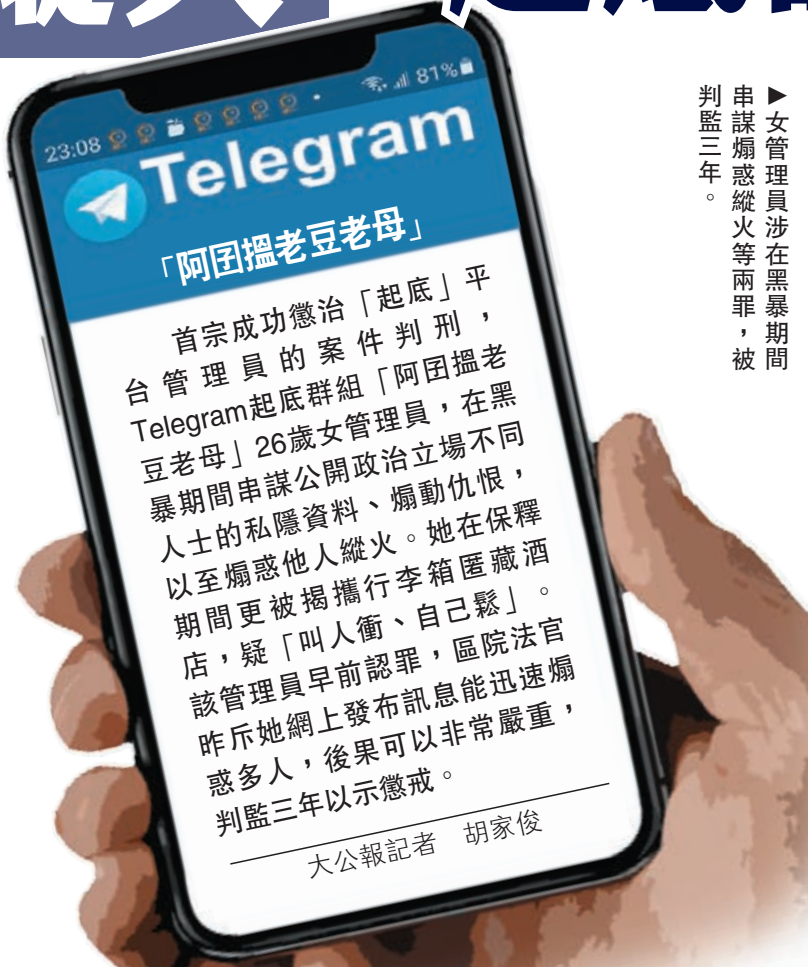
▶女管理員涉在黑暴期間串謀煽惑縱火等兩罪，被判監三年。