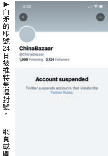
白矛的賬號24日被推特無理封鎖。網頁截圖

中國全國人大外事委員會22日表示，該法案充斥冷戰思維和意識形態偏見，肆意曲解、誣蔑抹黑中國發展戰略和內外政策，粗暴干涉中國內政，用心險惡，損人害己，對此表示強烈不滿和堅決反對。