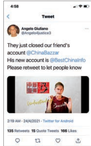
白矛新的推特賬號為@BestChinaInfo。網頁截圖