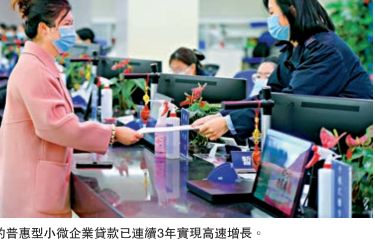
▲內地的普惠型小微企業貸款已連續3年實現高速增長。