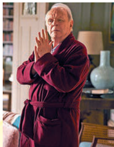
安東尼鶴健士在《爸爸可否不要老》中飾演患上腦退化症的爸爸。