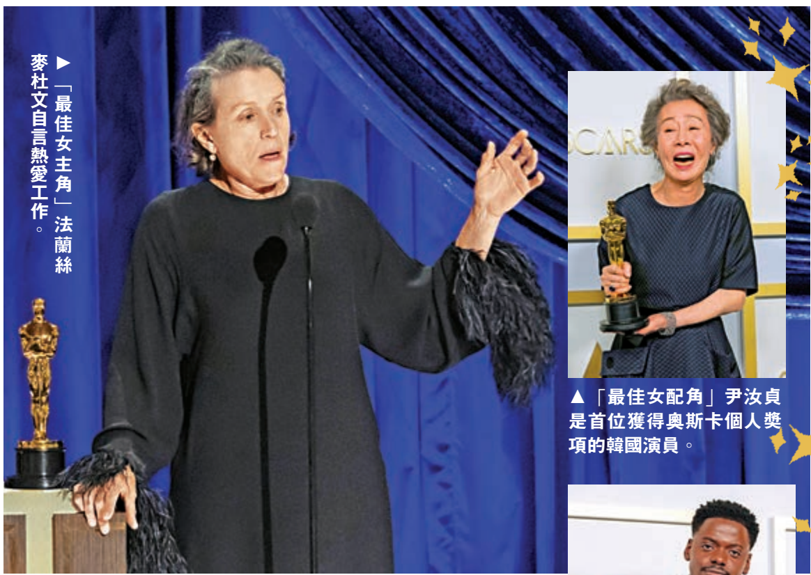
「最佳女主角」法蘭絲麥杜文自言熱愛工作。