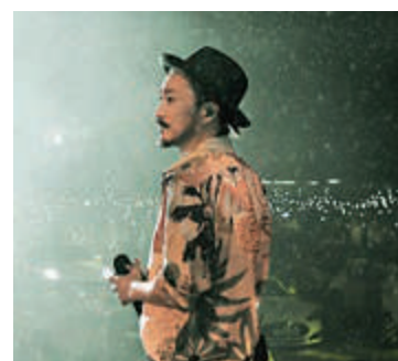
鄭中基首開戶外騷，主辦方供圖。