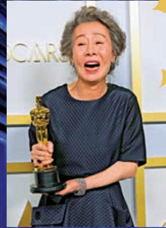
「最佳女配角」尹汝貞是首位獲得奧斯卡個人獎項的韓國演員。