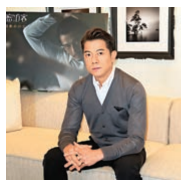
郭富城計劃今年舉行演唱會。