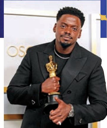
丹尼爾卡魯亞憑《猶大與黑色彌賽亞》喜獲「最佳男配角」。