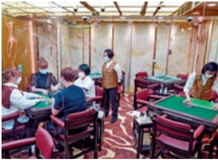
▲有麻雀館在枱與枱之間加設透明膠片分隔，加強防疫。