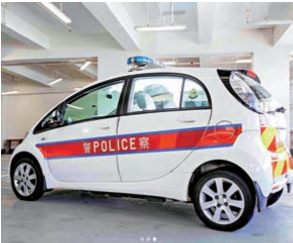
▲警方早前引入多輛電動警車。

至於物流署採購車輛方面，審計署抽查發現物流署完成車輛採購需時甚久，部分車輛更歷時超過三年才完成採購。此外，物流署亦逾期提交大量車輛使用量的每月報表。截至去年11月底，有988份每月報表逾期未交，最長逾期58個月。