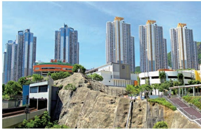
◀彩雲道及佐敦谷毗鄰的發展計劃現已建成彩德邨、彩福邨及彩盈邨等屋邨。