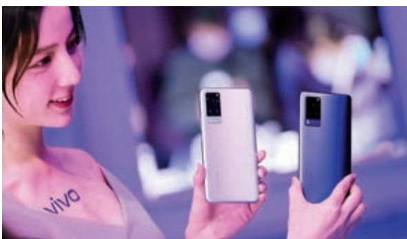
佔據全球第五位。▲Oppo上季銷售額錄得增長，資料圖片

14.1%、10.8%、10.1%。他們均如華為努力專注於拓展國際市場。市場份額最大的，仍然是三星和蘋果，三星憑着驚人的7530萬部付運量，21.8%的市佔率，重奪榜首位置。蘋果在iPhone 12系列持續熱賣之下，佔據排名榜次席，雖然被三星搶走部分市場份額，但付運量和市佔率仍然驚人，分別錄得5520萬部和16%。中國和亞太地區是全球最大兩個手機銷售市場，佔去整體的一半，兩個市場分別錄得30%和28%的按年增長。發布今次季度報告的IDC研究部董事Nabila Popal表示，市場復甦的步伐比預期還要快，清楚顯示出全球智能手機有健康的吸收能力。