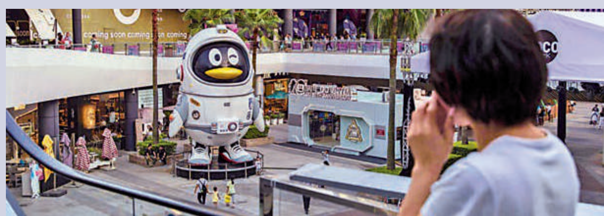
騰訊的罰款一旦少過阿里巴巴，會令市場擔心「出手過輕」。對騰訊的監管陸續有來。資料圖片