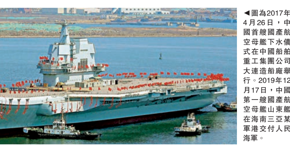
◀圖為2017年4月26日，中國首艘國產航空母艦下水儀式在中國船舶重工集團公司大連造船廠舉行。2019年12月17日，中國第一艘國產航空母艦山東艦在海南三亞某軍港交付人民海軍。