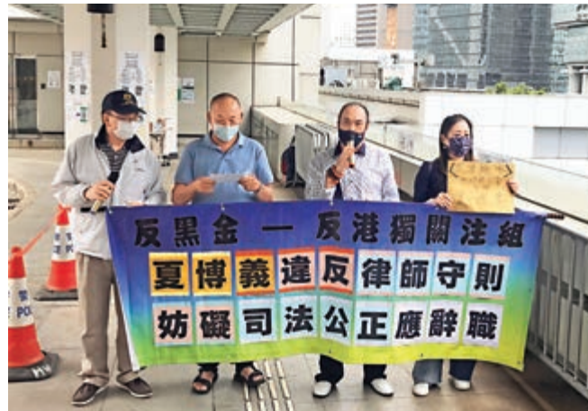
▲大律師公會主席夏博義自上任以來多次發表言論抹黑香港國安法及質疑法院判決，引發社會各界不滿，連日來市民紛紛到高等法院門外抗議。