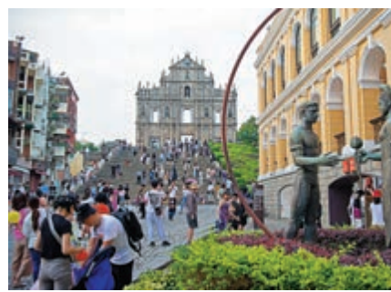
▲「五一」赴澳旅客明顯增多。