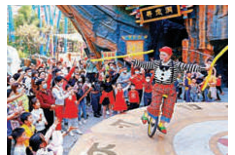
▲「五一」假期，深圳歡樂谷令許多遊客流連忘返。