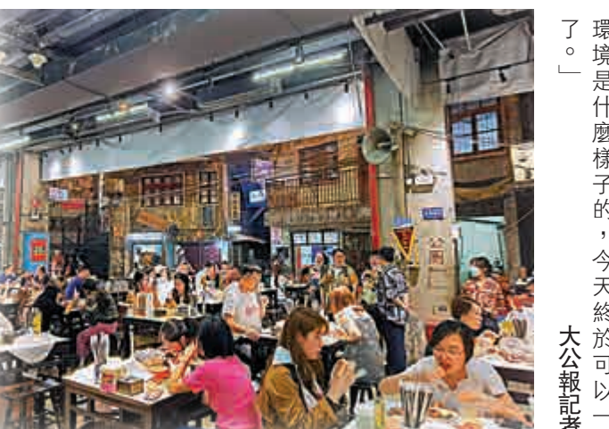
「在長沙文和友內老舊的街頭吃小龍蝦，別有一番風味。」

每到節假日，以「美食+懷舊」主打的長沙文和友龍蝦館，都會以排號數萬桌的新聞火上熱搜，去年的國慶黃金周，儘管受疫情影響，文和友依舊以「排號四萬號，等位兩萬人，客流峰值六點八萬人次」成為「網紅打卡」的熱門地點。晚上七點，文和友海街廣場店門外已經排起長長的隊伍，有數百位顧客在店外等待。長沙文和友共七層，是在現代感十足的商業綜合體內，復刻上世紀七八十年代長沙市井的舊貌。在這裏除了可以吃到傳統長沙美食，還能「穿越」回八十年代的長沙，感受火熱、親切的市井生活。