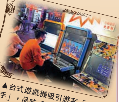
「台式遊戲機吸引遊客「一試身手」，品味「街機」快感。」