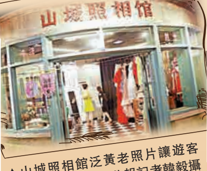
「山城照相館泛黃老照片讓遊客「回到過去」。」