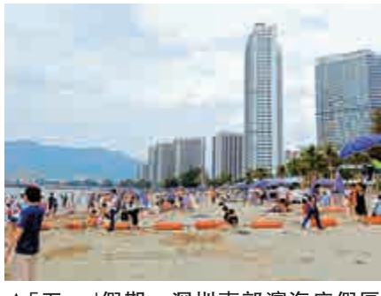
「五一」假期，深圳東部濱海度假區遊人如織。」

「五一」小長假，深圳東部濱海可謂熱度高漲，市民暫時逃離車水馬龍的熱鬧城市，在海邊沙灘暢遊，體驗「海、陸、空」娛樂項目，解鎖久違的戶外體驗，品嚐美味海鮮大飽口福，在純粹的山海自然中找尋理想生活的方向。