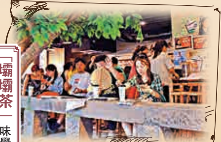
「遊客在品嚐重慶本土飲品壩壩茶。」