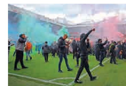
▲數百名曼聯球迷2日下午衝入奧脫福球場示威。

給利物浦，同城的曼城將成為本屆英超冠軍。曼聯球員於比賽前集宿的酒店門外，同樣有曼聯球迷聚集示威，令球員未能按時出發前往球場。