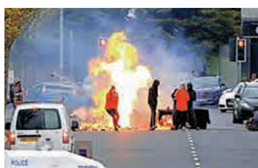
▲4月19日，北愛示威者在街頭投擲燃燒瓶。

蘇格蘭議會129席都將於6日改選，SNP料將保持第一大黨的地位，但能否擴大優勢非常關鍵。SNP黨魁施雅晴承諾，若贏得過半席位，就推動第二次蘇格蘭獨立公投。今年傾向獨立的綠黨支持率上升，