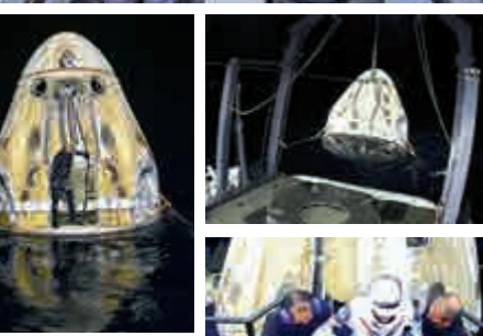
▲地面人員找到飛船。

4名太空人在過去的6個月中進行了數次實驗，包括模擬人體器官的組織芯片實驗、種植蘿蔔和其他蔬菜等，還進行了太空行走，並在太空站外部安裝設備，為新的太陽能電池板做準備。他們此次將研究樣品、個人物品和應急設施等一併裝入飛船帶回。