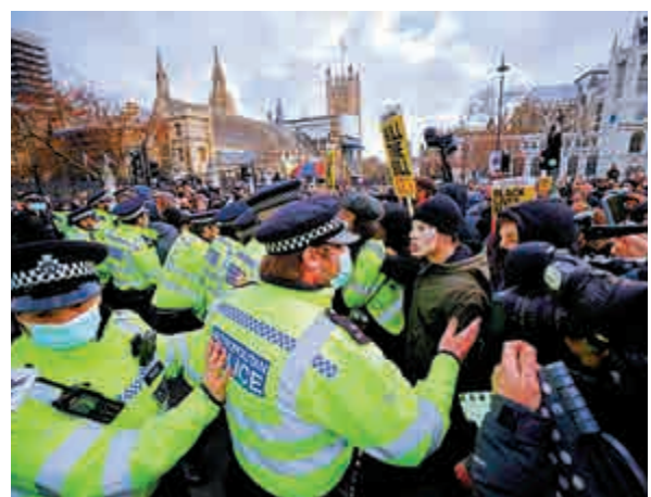
▲英國近期示威不斷，示威者多次與警方發生衝突。

英國內部風波不斷，約翰遜卻還試圖插手別國事務，多次跟隨美國對中國新疆、香港等問題指手畫腳。上周，英國政府宣布將於本月派遣「伊麗莎白女王」號航母戰鬥群奔赴太平洋，進行為期28周的首次作戰部署，並訪問日本、印度等40多個國家。3日，英國將作為G7輪值主席國，在倫敦主持兩年來首場G7外長面對面會議。英國政府稱，英方將與美國共同討論中國議題。有分析認為，英國對外動作不斷，是希望轉移公眾視線、掩蓋「內亂」。