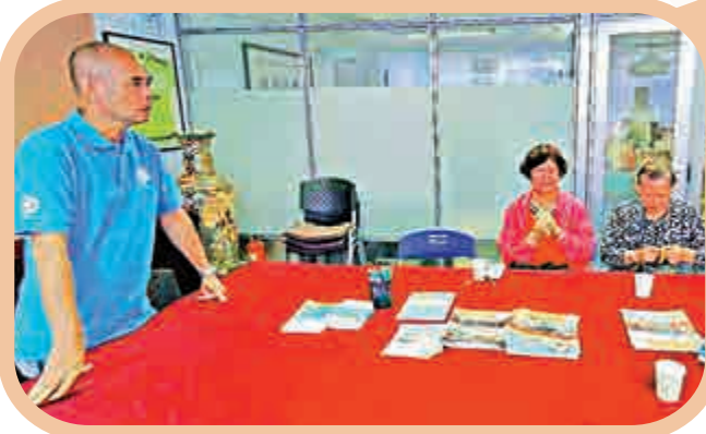
▲港歸長者在香港工聯會廣州中心諮詢。