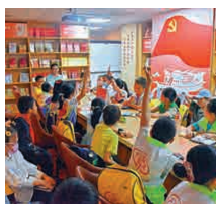
▲圖為穗港澳青少年在現場學習黨史和法律。

記者了解到，廣州青少年黨史學習教育陣地已於4月30日正式對外開放，被共青團廣東省委員會授為「廣東省青少年教育基地」。