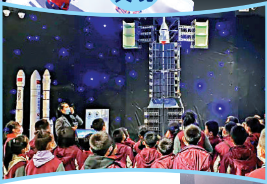
▲小朋友觀摩火箭發射。