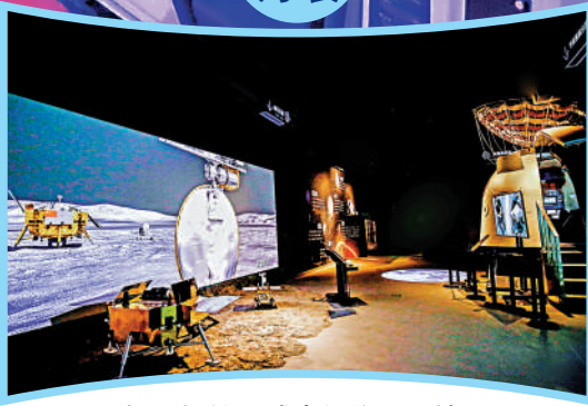
▲現場可操控月球車採集「月壤」。