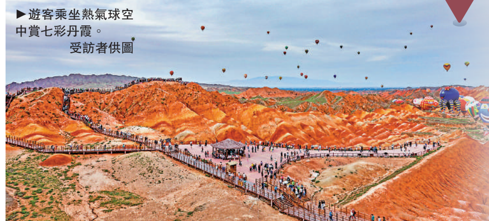
▶遊客乘坐熱氣球空中賞七彩丹霞。

種享受，美觀豐富的山嶺色彩讓人心靈震撼！」業界人士告訴記者，據不完全統計，七彩丹霞的色彩種類有13種之多，從高空衛星地圖來看，整個景區在50平方公里的範圍內形成了三條綵帶，尤為壯觀。此外，丹霞地貌似人似物的地貌群，營造出一個光怪陸離、變化無窮的平行世界。「欣賞七彩丹霞的奇妙之處，空中是最好的角度，熱氣球是一種相對經濟適用的飛行方式。」