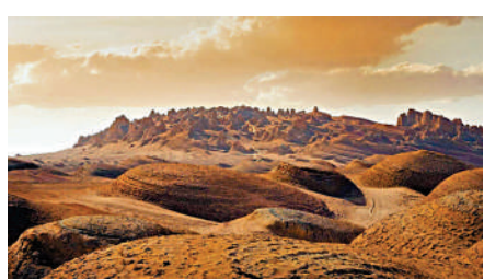
▲俄博梁雅丹被稱為「地球上最像火星的地方」。

「我們又可以自由登陸『火星』了，在戈壁仰望星空看星星了。」今年「五一」前，中國冷湖火星小鎮俄博梁雅丹重新開放的公告，一時間讓很多航