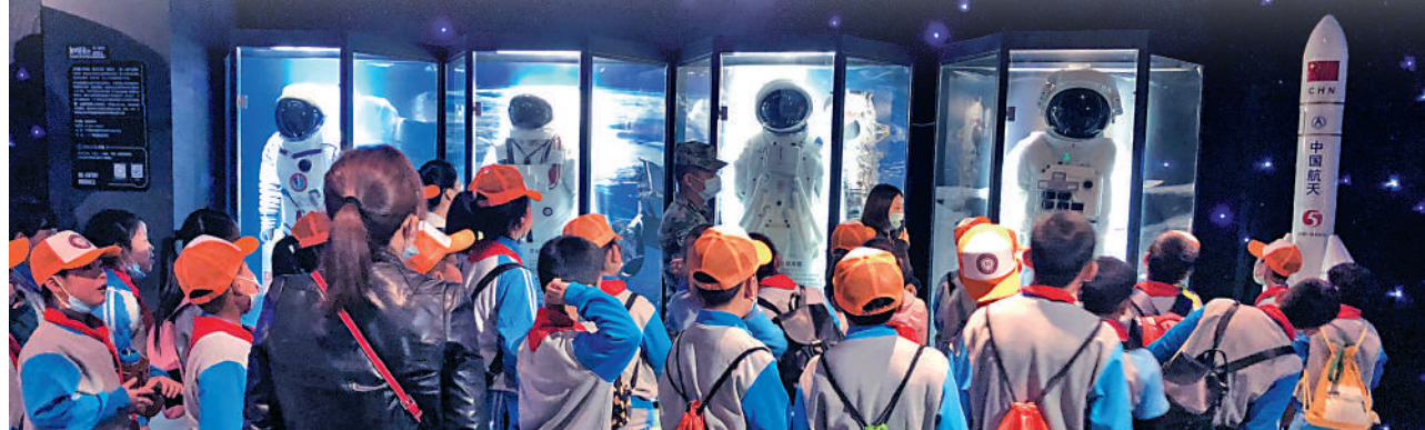
▲九號宇宙展陳列品豐富。