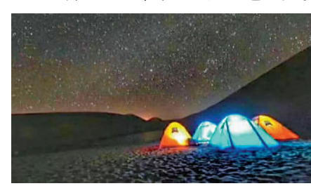
▲沙漠觀星讓都市人煩惱盡消。

後的第一個夜晚，抬頭可見的璀璨星河，更是讓她如入夢境。「果然是名不虛傳，絕對是中國最佳觀星地之一。」據介紹，近年來，為豐富遊客在寧