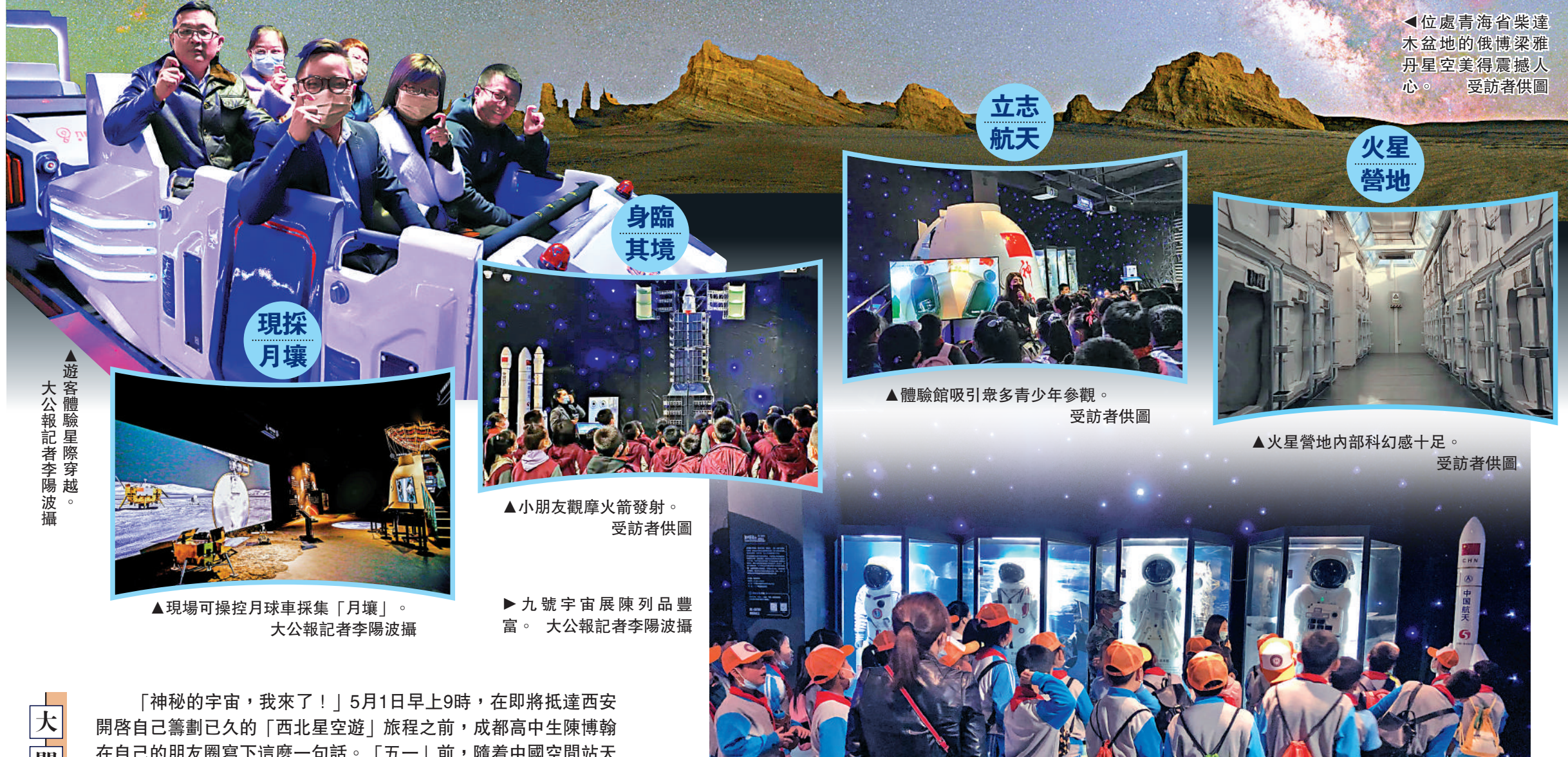
◀位處青海省柴達木盆地的俄博梁雅丹星空美得震撼人心。