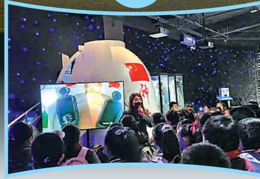
▲體驗館吸引眾多青少年參觀。