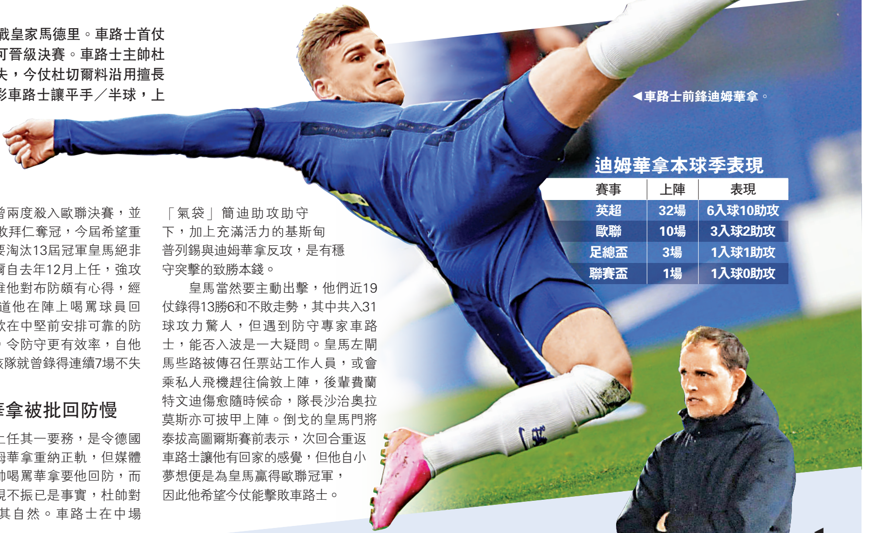
車路士前鋒迪姆華拿。