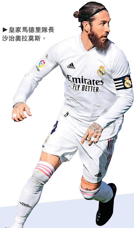
皇家馬德里隊長沙治奧拉莫斯。

車路士曾兩度殺入歐聯決賽，並於2012年擊敗拜仁奪冠，今屆希望重溫舊夢，但要淘汰13屆冠軍皇馬絕非易事。杜切爾自去年12月上任，強攻成效一般，惟他對布防頗有心得，經常被媒體報道他在陣上喝罵球員回防，而他喜歡在中堅前安排可靠的防守中場球員，令防守更有效率，自他執教以來，該隊就曾錄得連續7場不失球走勢。