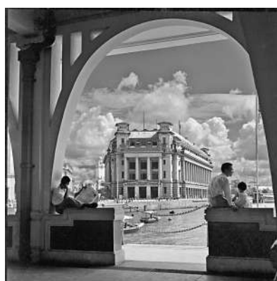
▲克利福德碼頭拱道下的浮爾頓灣大酒店。