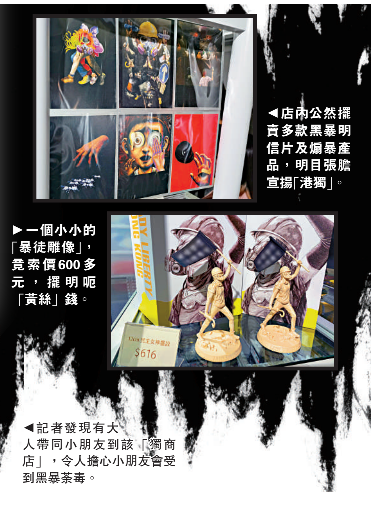
◀店內公然擺賣多款黑暴明信片及煽暴產品，明目張膽宣揚「港獨」。