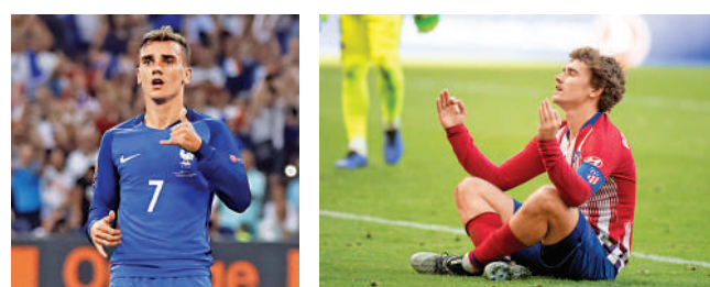
▲打坐慶祝別樹一幟。