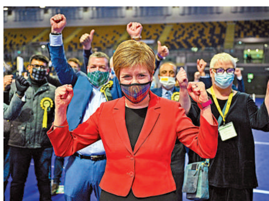
▲蘇格蘭首席部長施雅晴7日在格拉斯哥向支持者致意。

【大公報訊】據BBC報道：英國地方選舉投票結果陸續出爐，謀求蘇格蘭獨立的蘇格蘭民族黨在愛丁堡中部等三個關鍵戰場贏得議席，但能否在蘇格蘭議會中贏得過半席位仍存疑。民族黨黨魁、蘇格蘭首席部長施雅晴曾表示，如果民族黨贏得過半議席，她將爭取在2023年底前再次舉行獨立公投。英國首相約翰遜則重申，不會容許蘇格蘭再次獨立公投。