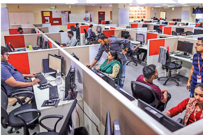
▲班加羅爾一家為外國企業服務的呼叫中心。資料圖片

去年中國發生疫情後，印度迫切希望能佔領中國「退出」後的製造業空白領域。但中國迅速控制了疫情，實現經濟復甦，吸引不少印度和東南亞地區的訂單回流。今年前4個月，中國貿易貨物進出口總值11.62萬億元，同比增長28.5%，延續了穩中向好的態勢。