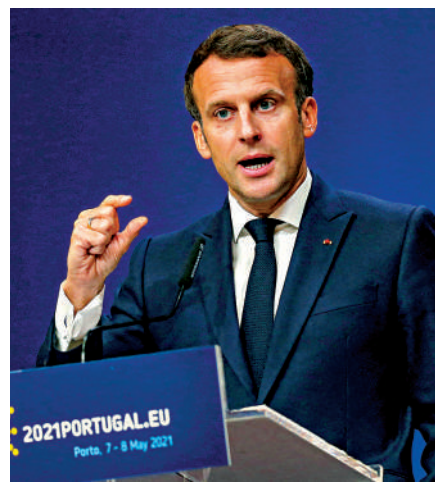
▲法國總統馬克龍8日出席在葡萄牙波爾圖舉行的歐盟峰會。

目前，由於自產疫苗供應相對充足，美英在疫苗接種率上大大領先於歐洲大陸。截至5月8日，英國至少接種一針的比例達52.5%，美國達45.3%，而歐盟國家排名相對靠後，德國為31.6%，法國27.0%。