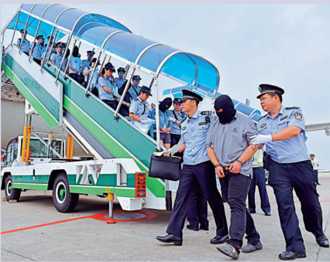
▲大陸方面嚴厲打擊騙案。圖為2016年多名台灣電信網絡詐騙犯罪嫌疑人從亞美尼亞被帶回中國大陸。