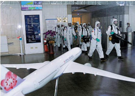
▲台軍化學兵近日前往華航園區進行消毒。

【大公報訊】據中通社報道：中華航空及華航機場飯店群聚疫情未歇，當局日前針對華航啟動「清零計劃」，機組員居家檢疫時間從3天延長到5天，並進行9天加強自主健康管理，其間採檢5次。短程航班機組員，檢疫維持14天一般自主健康管理，其間進行2次採檢，導致排班緊張，約200名機師無法執飛。 華航內部表示，預計5月12日起大規模削減航班。部分歐洲航線如法蘭克福、荷蘭恐怕暫時停航。