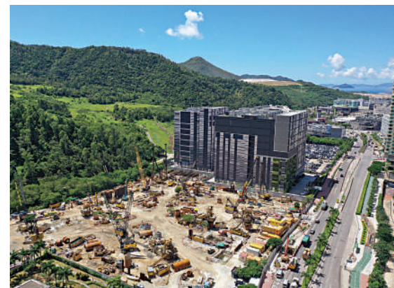
▲新意網位於將軍澳的數據中心MEGA Plus，旁邊的新數據中心正在動工中，預計2022年起分階段落成。