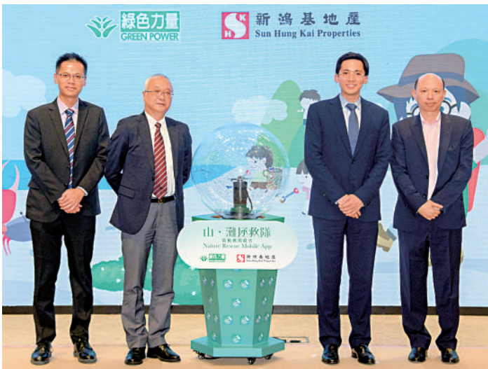
▲新地與綠色力量合作，推出「山·灘拯救隊」應用程式，促進公眾身體力行實踐環保。

環保工作方面，新地與綠色力量合作，推出「新地齊心愛自然」計劃，定期組織沙灘、郊野公園清潔垃圾，2018年起又製作「山·灘拯救隊」手機應用程式，推動社會大眾環境保護、愛護自然意識。